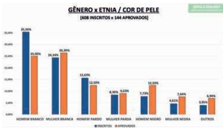
Gráfico 3: Porcentagem de projetos aprovados na modalidade Incentivo Fiscal do Edital LMIC 2018-2019 por Gênero e Etnia/Cor de Pele dos Empreendedores. Disponível em: https://prefeitura.pbh.gov.br/cultura/lei-municipal-de-incentivo-cultura-lmic . Acesso em 10/10/2020