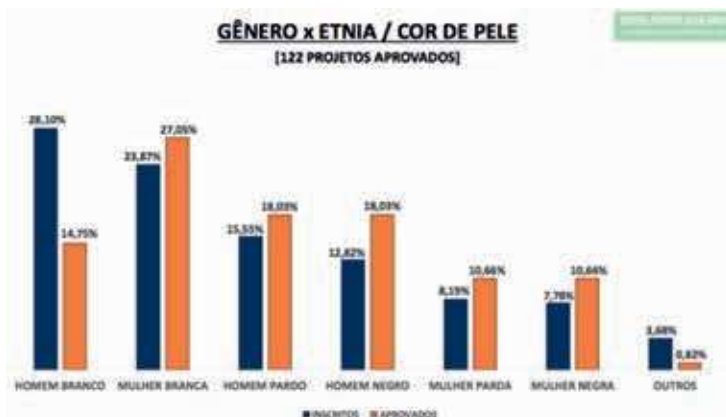
Gráfico 2: Porcentagem de projetos aprovados na modalidade Fundo do Edital LMIC 2018-2019 por Gênero e Etnia/Cor de Pele dos Empreendedores. Disponível em: https://prefeitura.pbh.gov.br/cultura/lei-municipal-de-incentivo-cultura-lmic . Acesso em 10/10/2020