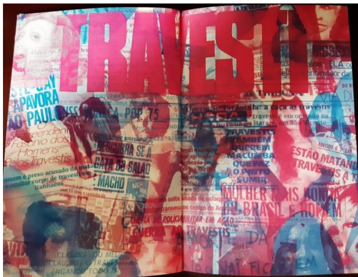
Figura 2. Segunda capa do livro da peça Manifesto transpofágico

Se na apresentação a atriz entra no palco com a luz direcionada apenas para parte de seu corpo, o jogo de luz e sombras é fundamental para a condução do espetáculo. No livro, as primeiras páginas surgem em preto com o texto em letra branca. A escrita aparece como fragmentos, como “flashes de luz” que antecedem o texto propriamente dito, uma atmosfera é criada no leitor que podemos aproximar aos momentos que antecedem a entrada da atriz em cena no teatro. Nessas páginas, anunciam-se os três sinais como convenção teatral e descreve-se o corpo postado como um manequim. Um pacto se estabelece com o leitor, um compromisso de atenção e silêncio, assim o olhar é capturado pelas páginas.