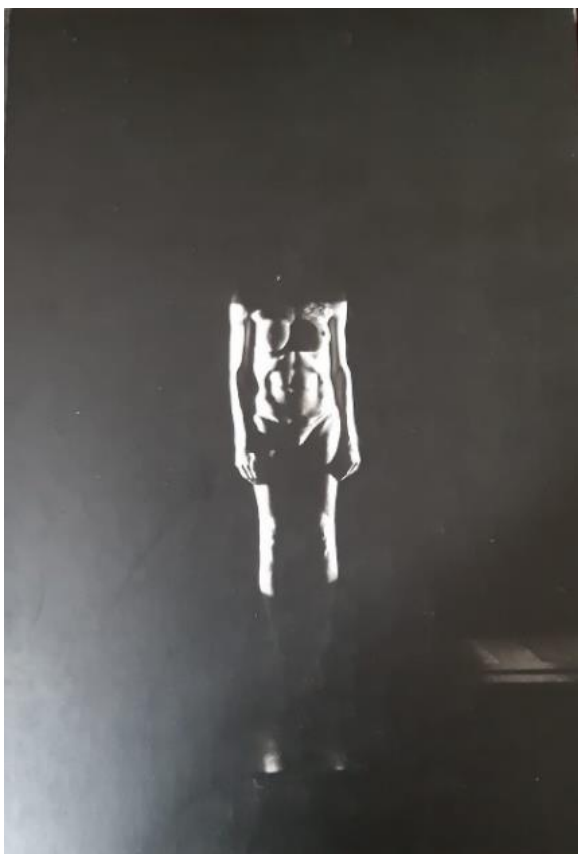
Figura 1. Capa do livro Manifesto transpofágico

para a leitura do texto impresso. A capa traz o corpo da personagem em branco e preto, o rosto não aparece, apenas o tronco e os membros iluminados em um fundo de blackout, conforme a Figura 1.