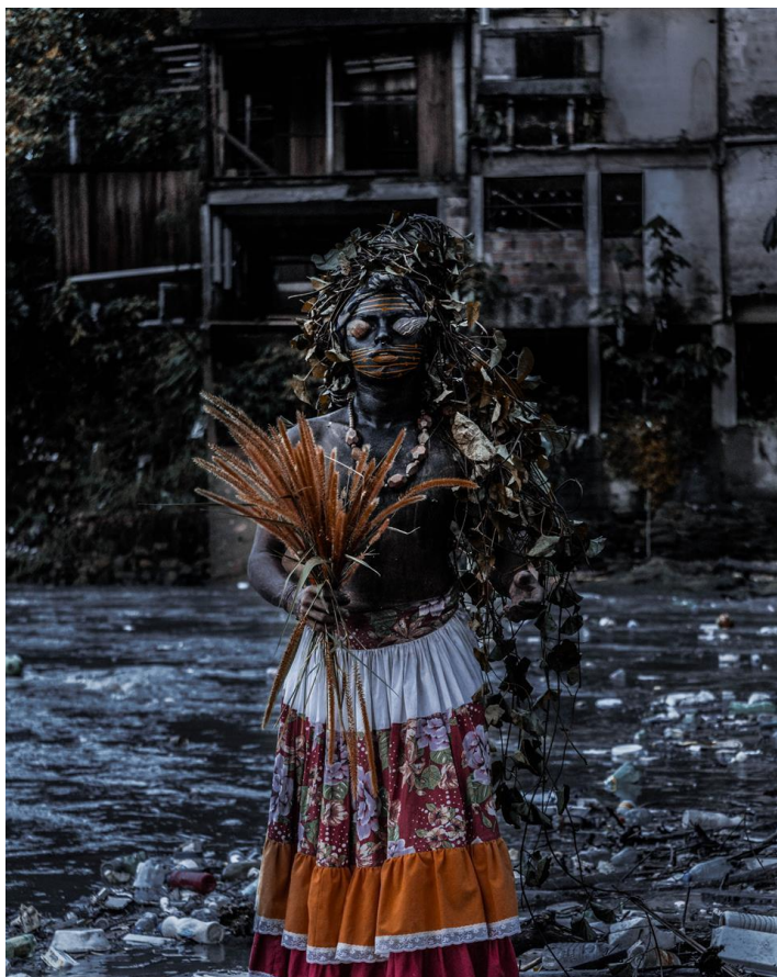
Figura 2. Série Mil Mortos