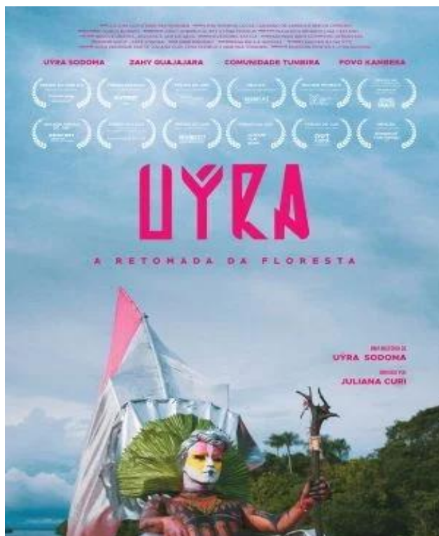
Figura 1. Cartaz do filme Uýra: a retomada da floresta

de 2022 Uýra: a retomada da floresta, com direção de Juliana Curi, cujo cartaz podemos ver na Figura 1.