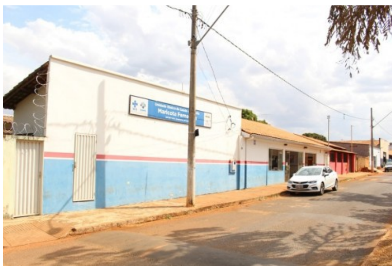
Figura 2 – A Unidade Básica da Equipe de Saúde da Família Maricota Fernandes, em Monte Carmelo, Minas Gerais