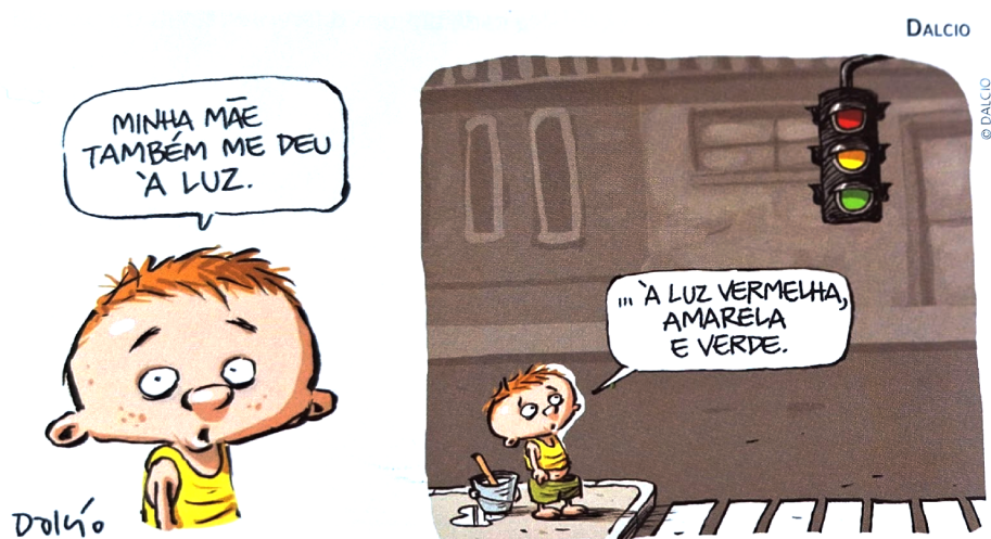
Figura 1 - Charge

A crase, portanto, não deve ser considerada um sinal gráfico; é reconhecida pelas autoras como um fenômeno relacionado a um processo “[...] fonológico por meio do qual dois fonemas vocálicos idênticos realizam-se, na fala, como um único fonema. Na escrita esse fenômeno é marcado pelo uso de acento grave.” (Abaurre et al , 2021, p. 647). É válido esclarecer que, anteriormente à explicitação do conceito, as autoras definem, em caixa de texto específica, os objetivos de aprendizagem no capítulo e propõem atividades de leitura e interpretação de um texto predominantemente imagético, uma charge.