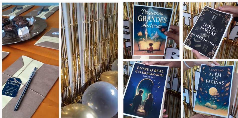
Figura 3 – Entrega dos livros realizada na escola: Fotografia do momento em que os alunos receberam seus livros.

tivessem o próprio livro em mãos, e oferecer a eles uma lembrança concreta da experiência de autoria, fortalecendo o sentimento de pertencimento e valorização de seu trabalho. A entrega dos exemplares foi realizada em um momento coletivo na escola, marcado pela celebração das produções literárias e pela socialização das histórias criadas (Figura 3).