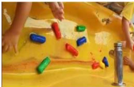
Figura 1 - Atividade com o gelo colorido feito pelas crianças da Educação Infantil

Além disso, apresento elementos visuais e atividades para educação infantil a partir de minhas experiências em sala de aula. Pois, a habilidade de produzir e interpretar imagens devem ser estimulados desde a infância, no contexto escolar, assim a apropriação da linguagem visual desenvolve a expressão pessoal, os aspectos emocionais, análise crítica e aspectos cognitivos.