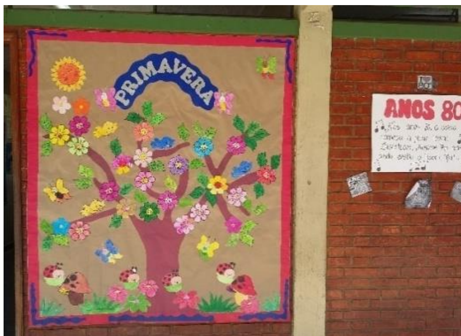
Figura 3 - Primavera – Arte mural referente ao tema primavera

Fonte: Murais da E. E. Chiquinha Soares – alunos do 5º ano