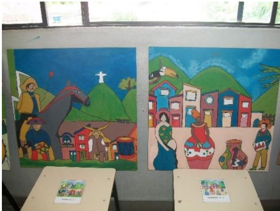
Figura 15 – Releitura de obras de Thaís Ibañez