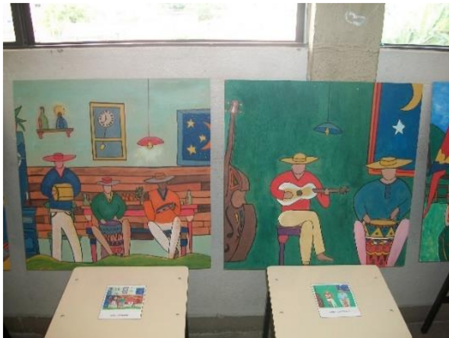
Figura 18 – Releitura de obras de Thaís Ibañez