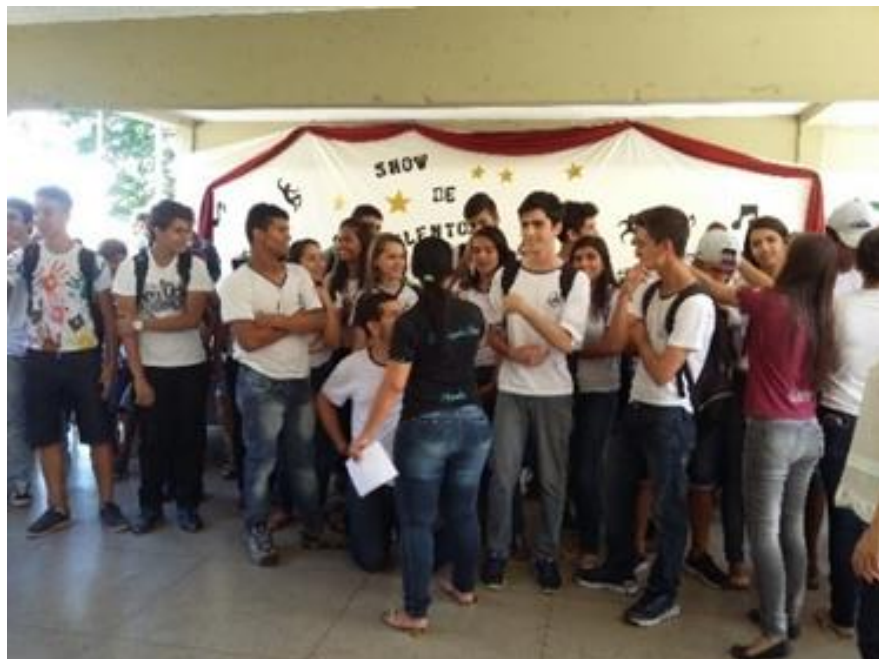
Figura 5 – Alunos do 3º ano com a Professora de Língua Portuguesa 16