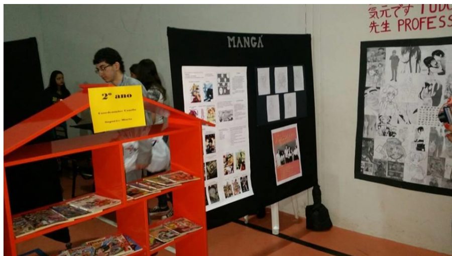
Figura 29 – Literarte 2015, estandes com trabalhos dos alunos