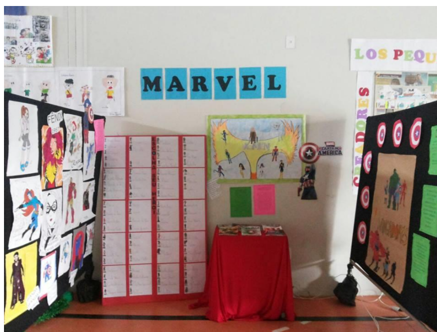
Figura 27 – Literarte 2015, estande com trabalhos dos alunos