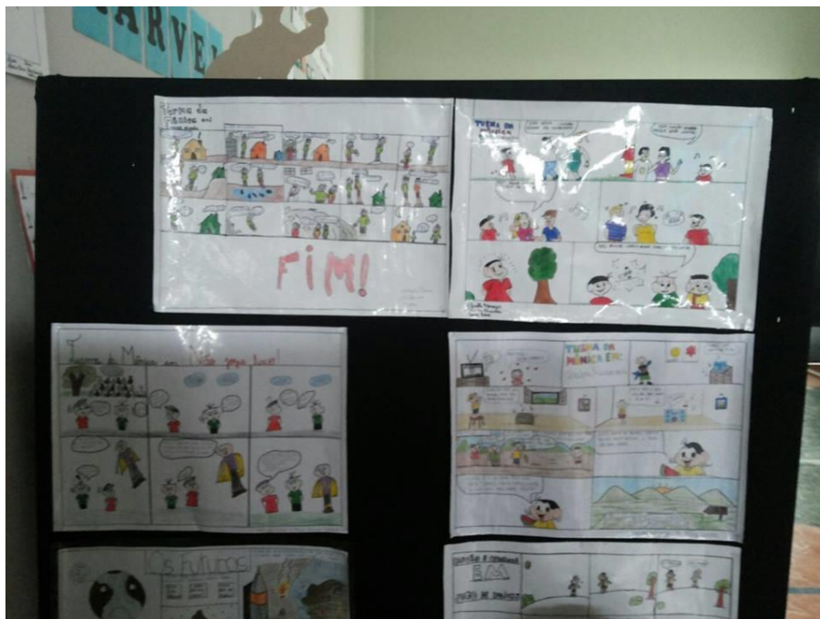
Figura 25 – Literarte 2015, estande com trabalhos dos alunos