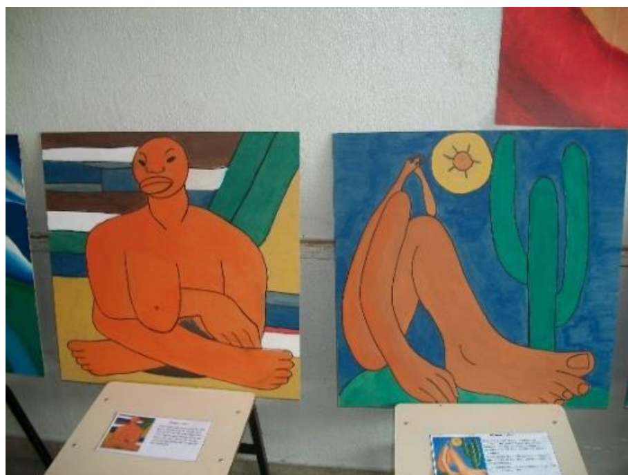
Figura 22 – Releitura de obras de Tarsila do Amaral