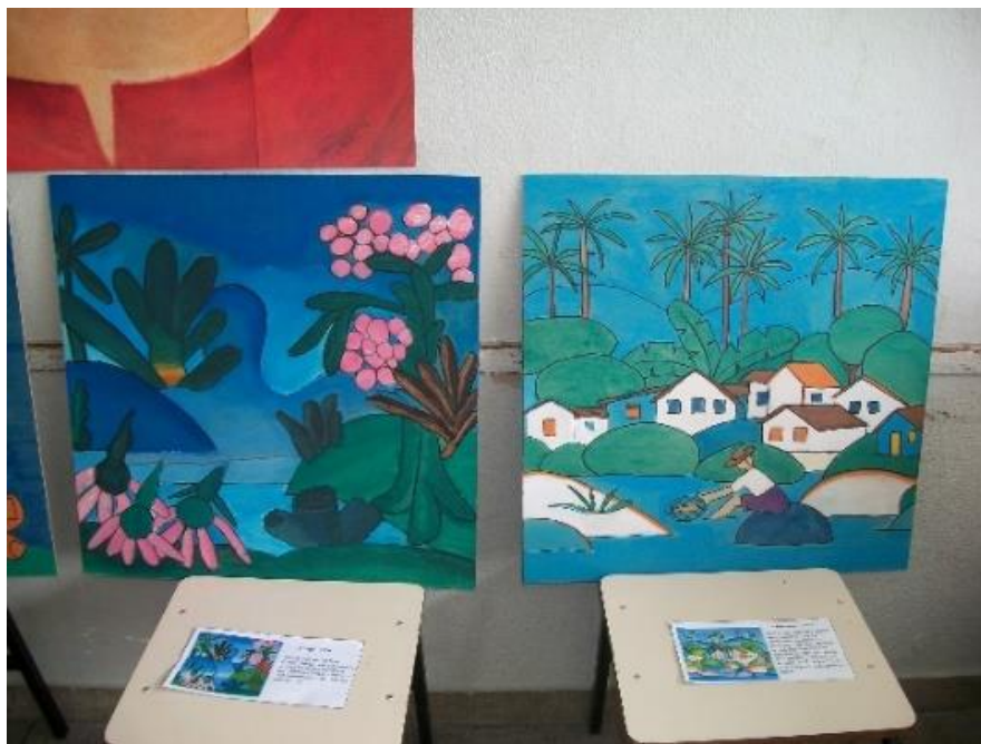
Figura 21 – Releitura de obras de Tarsila do Amaral