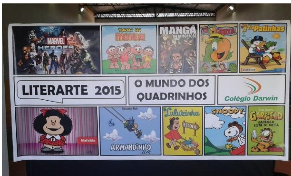
Figura 9 – Banner da entrada do evento Literarte 2015

Para a apresentação ao público no evento Literarte, a ideia era de se fazer um pequeno vídeo, cuja história seria criada, representada e filmada pelos alunos e com o auxílio do professor seria feita a edição. Porém, algumas mães não permitiram que seus filhos ficassem se reunindo fora da escola e a ideia do vídeo foi substituída pela apresentação da mesma história criada por eles em forma de teatro, o que não fez perder o brilho, o entusiasmo e o empenho dos alunos na execução das atividades. As Figuras 9, 10, 11 e 12 refletem alguns momentos deste trabalho e demais Figuras estão disponibilizadas no anexo 3.2.