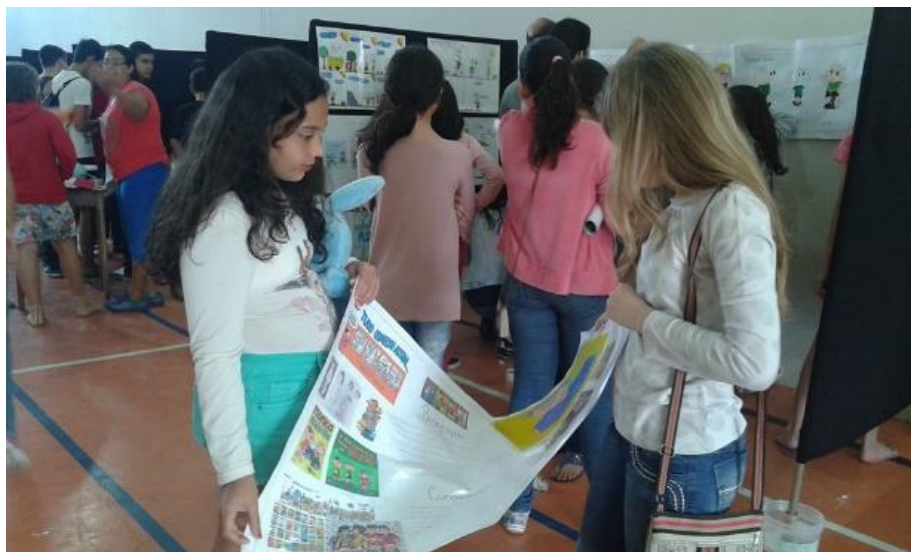
Figura 10 - Alunos e professores na montagem dos estandes para o Literarte