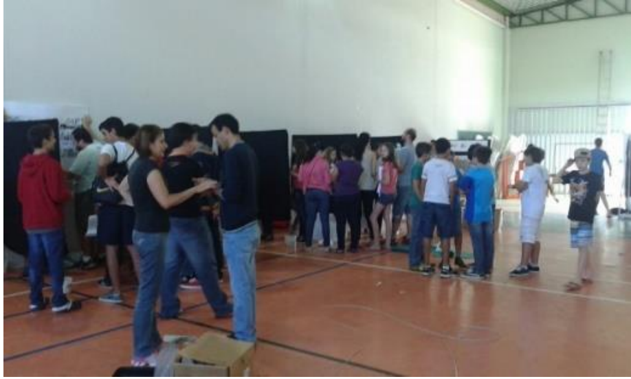
Figura 24 – Literarte 2015, professores e alunos montando os estandes