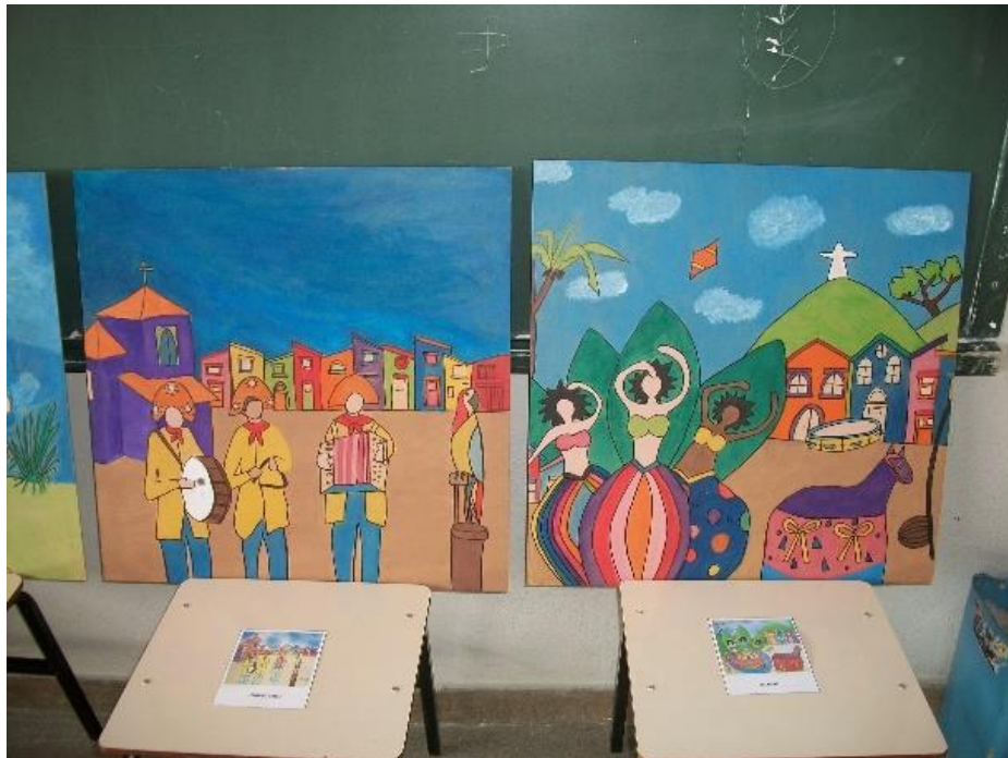
Figura 6 – Releitura de obras de Thaís Ibañez

As Figuras 6, 7 e 8 são algumas destas releituras desenvolvidas pelos alunos, demais Figuras estão disponibilizadas no anexo 3.1.