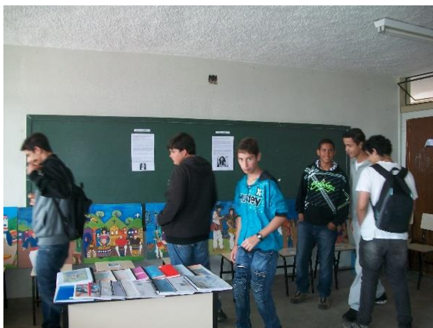
Figura 8 – Exposição dos trabalhos na feira cultural da escola Chiquinha soares