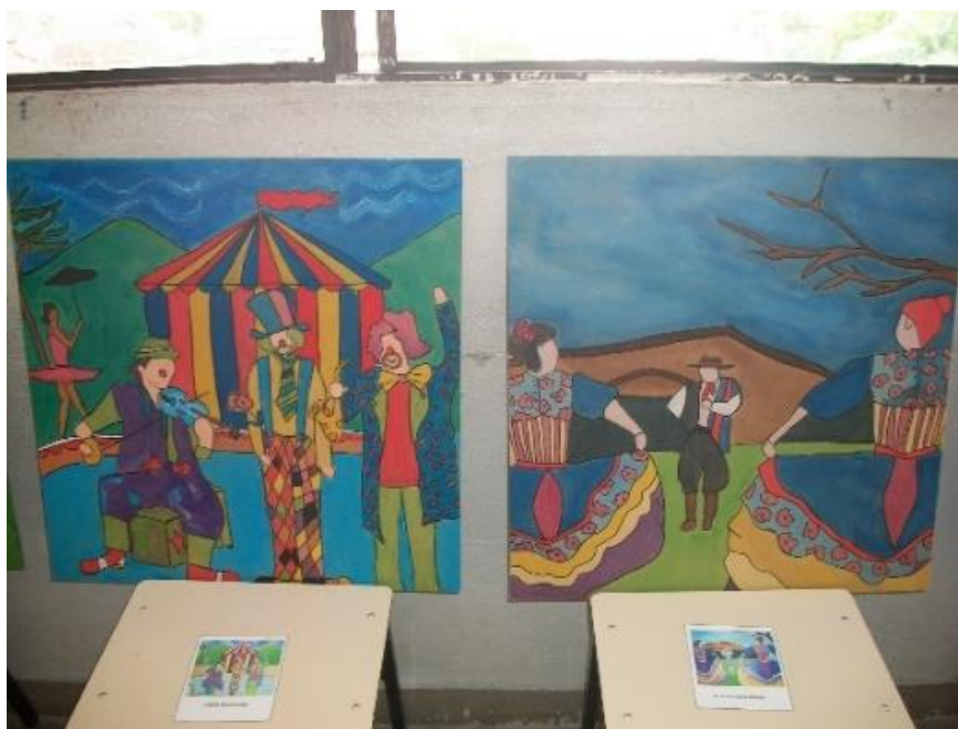
Figura 19 – Releitura de obras de Thaís Ibañez