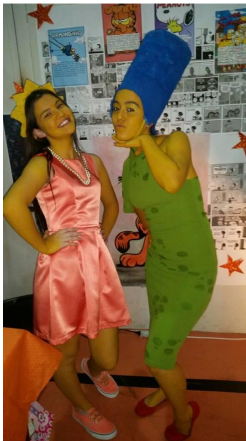
Figura 32 – Literarte 2015, alunas preparadas para apresentação teatral frente a um dos estandes com produções dos alunos