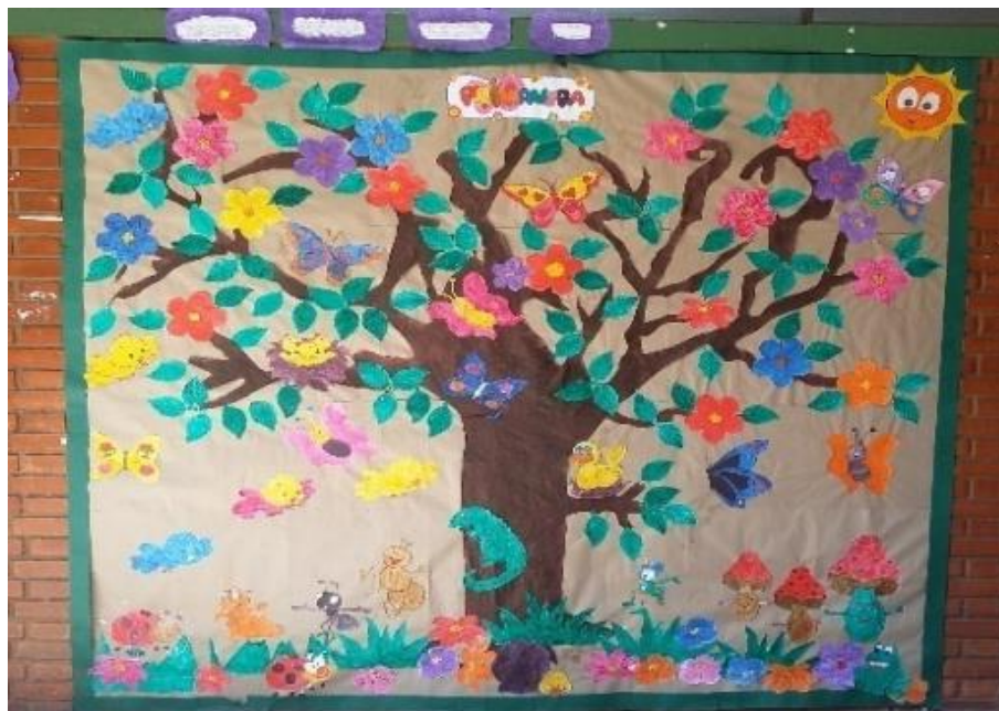
Figura 2 – Primavera - Arte referente ao tema Primavera