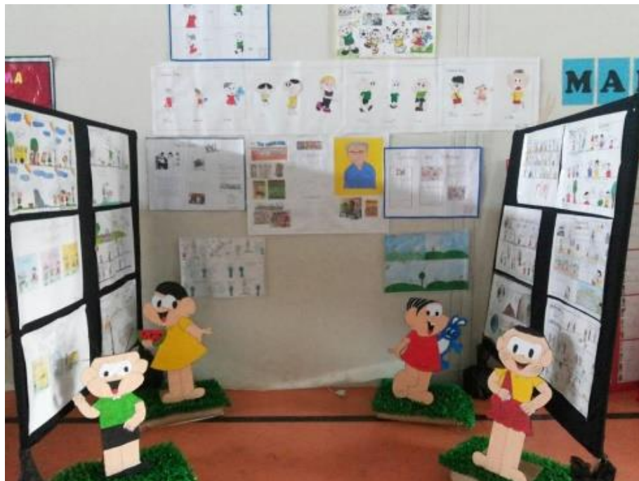
Figura 31 – Literarte 2015, estandes com trabalhos dos alunos