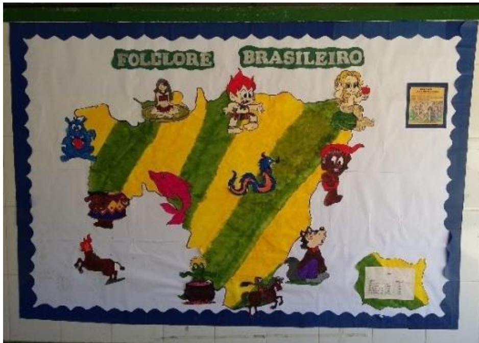
Figura 4 – Folclore brasileiro – Arte mural referente ao tema Folclore

Fonte: Murais da E. E. Chiquinha Soares – alunos do 5º ano