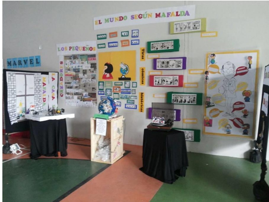
Figura 30 – Literarte 2015, estandes com trabalhos dos alunos