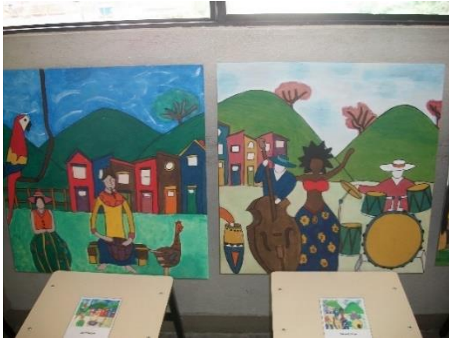
Figura 17 – Releitura de obras de Thaís Ibañez