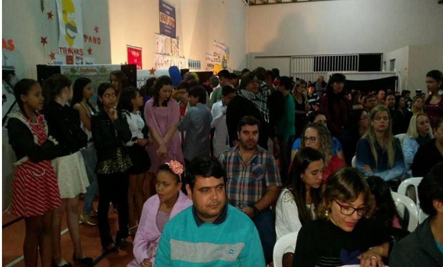
Figura 12 – Noite de apresentação do Literarte