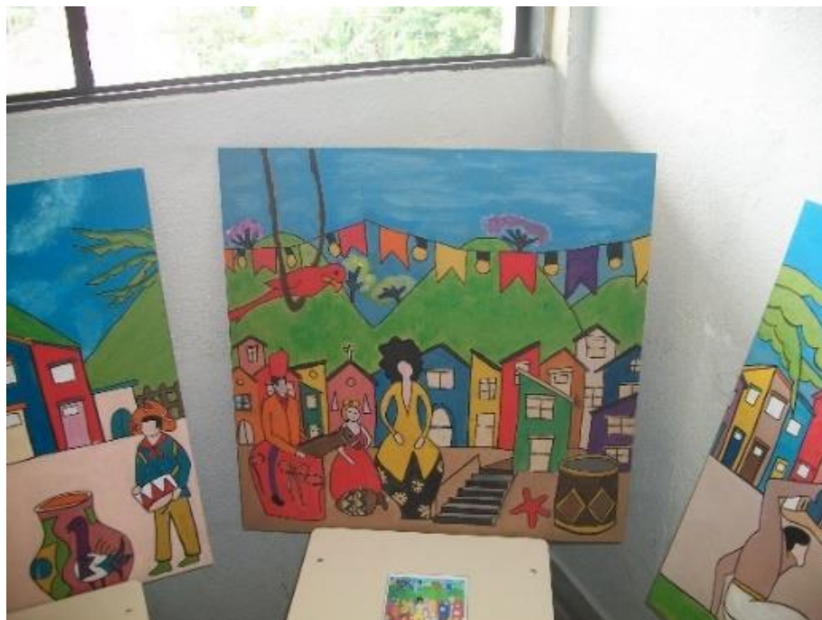
Figura 16 – Releitura de obras de Thaís Ibañez