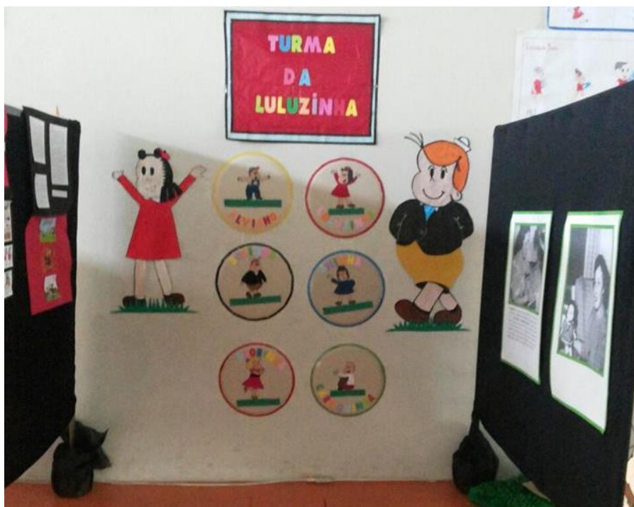
Figura 11 – Estande com produções dos alunos do 8º ano