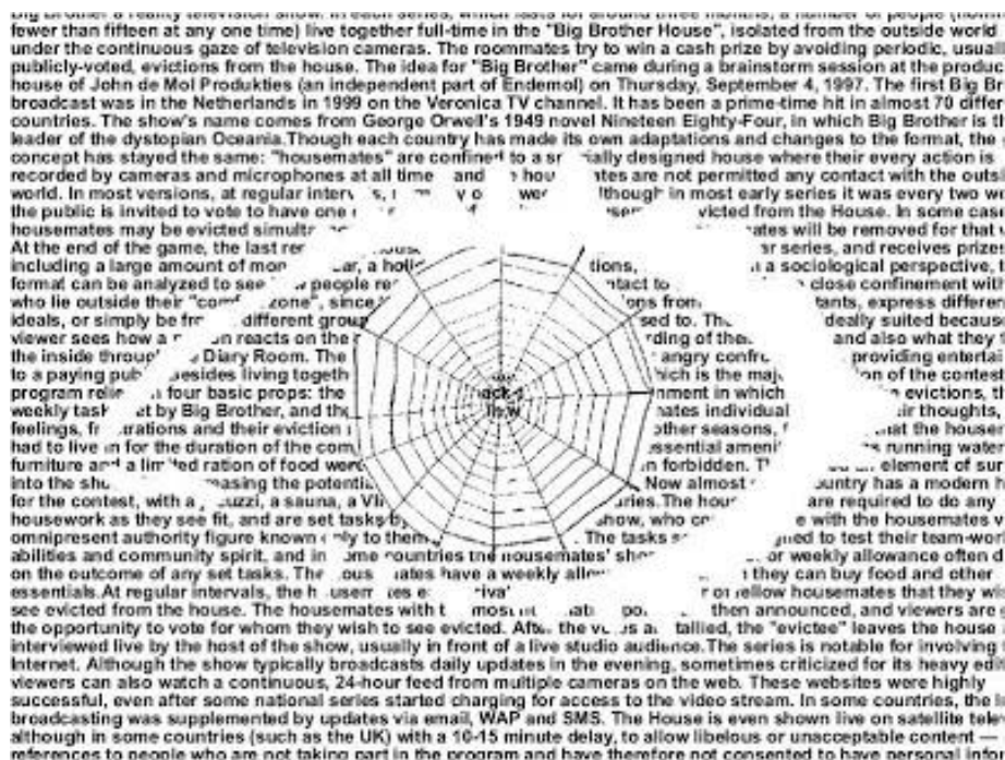
Figura 1 – Perspectiva holística da realidade 14