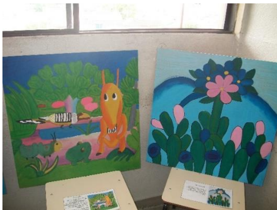
Figura 20 – Releitura de obras de Tarsila do Amaral