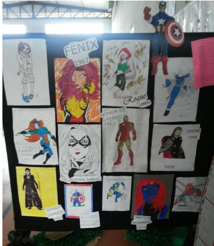
Figura 28 – Literarte 2015, estandes com trabalhos dos alunos