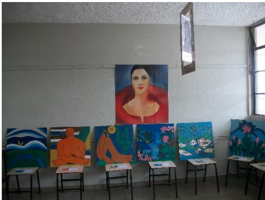
Figura 7 – Releitura de obras de Tarsila do Amaral