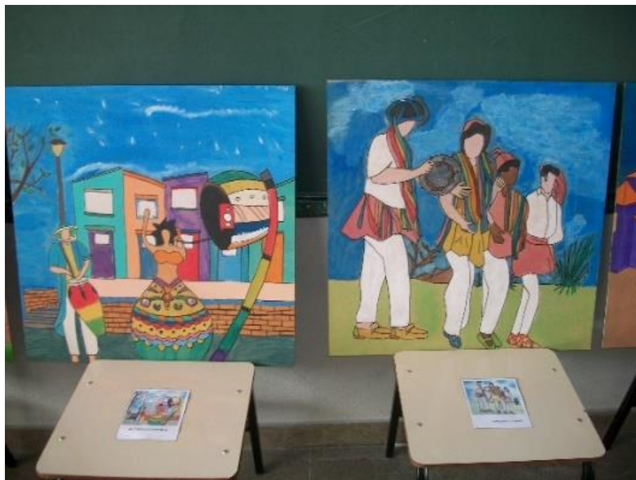
Figura 13 – Releitura de obras de Thaís Ibañez