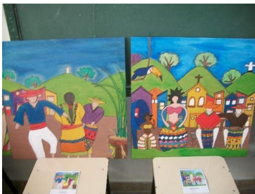
Figura 14 – Releitura de obras de Thaís Ibañez