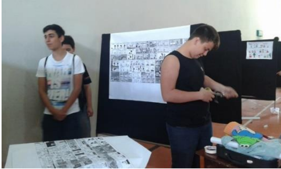
Figura 24 – Literarte 2015, alunos montando os estandes