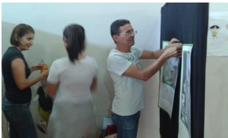
Figura 23 – Literarte 2015, professores ajudando na montagem dos estandes