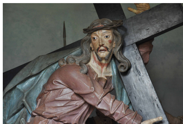
Figura 1. Os Passos da Paixão de Cristo (Escultura: Antônio Francisco Lisboa, o Aleijadinho)

Para a construção da proposta de metodologia para registro fotográfico de esculturas de arte sacra, foram considerados, de maneira individualizada, os atributos dos dois tipos de documento iconográfico: os atributos da fotografia e os atributos da escultura.