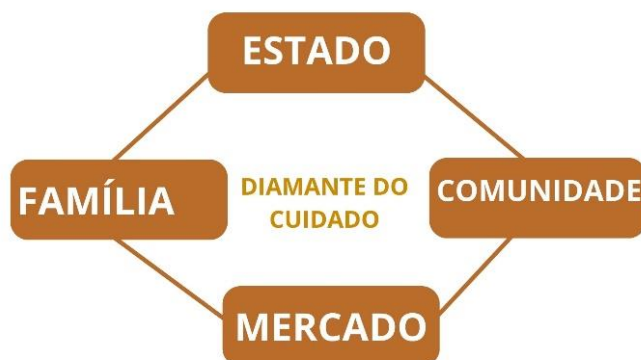
Figura 2: Diamante do cuidado