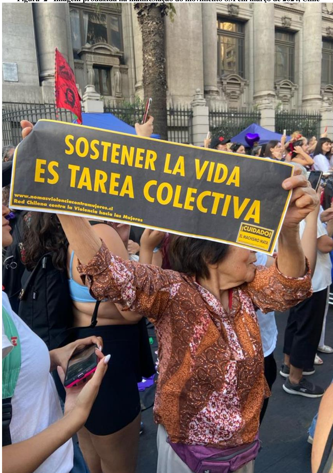
Figura 2– Imagem produzida na manifestação do movimento 8M em março de 2024, Chile