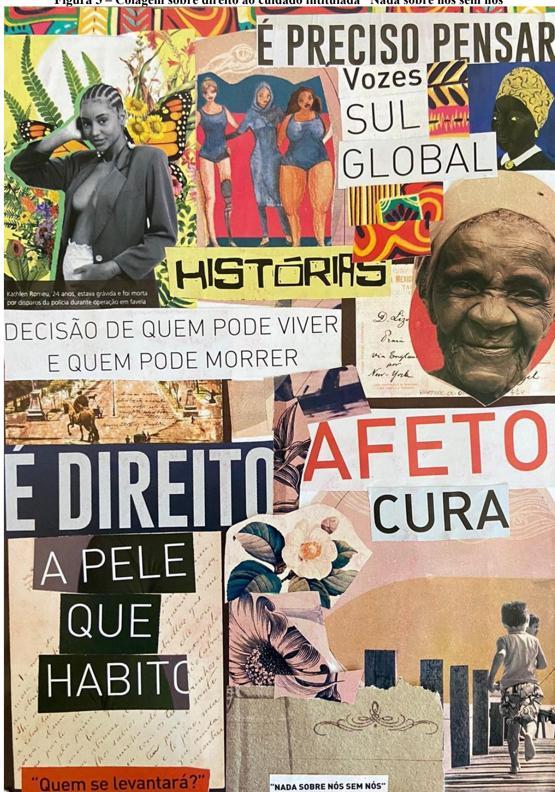
Figura 3 – Colagem sobre direito ao cuidado intitulada “Nada sobre nós sem nós”