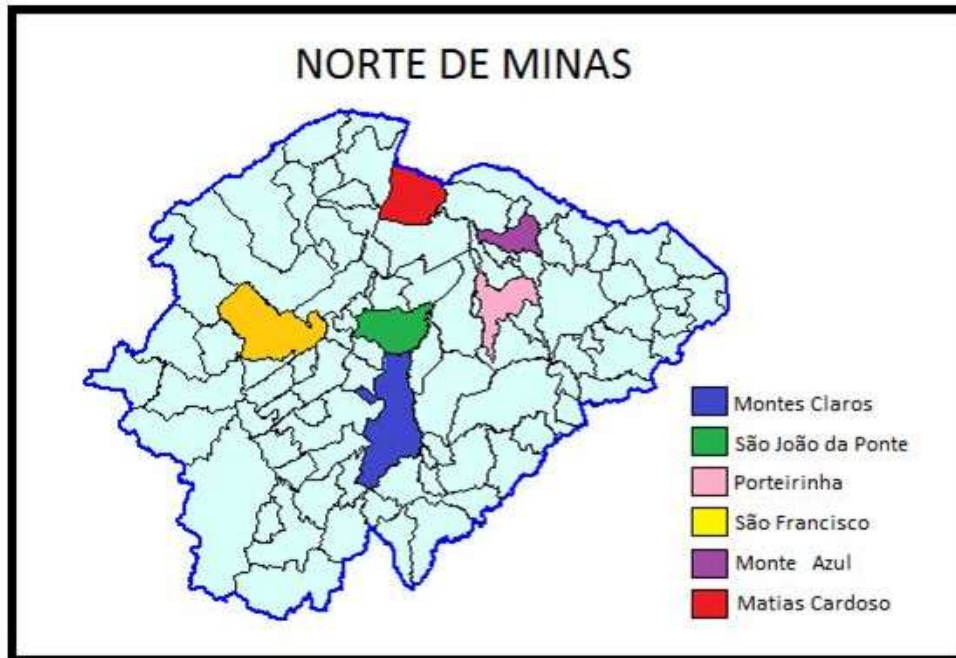
Figura 1. Mapa do Norte de Minas, Minas Gerais, Brasil

dualismo do Estado a imagem de dinamismo se superpõe a uma tradição de atraso que caracteriza toda a metade norte do Estado” (PEREIRA, 2007).