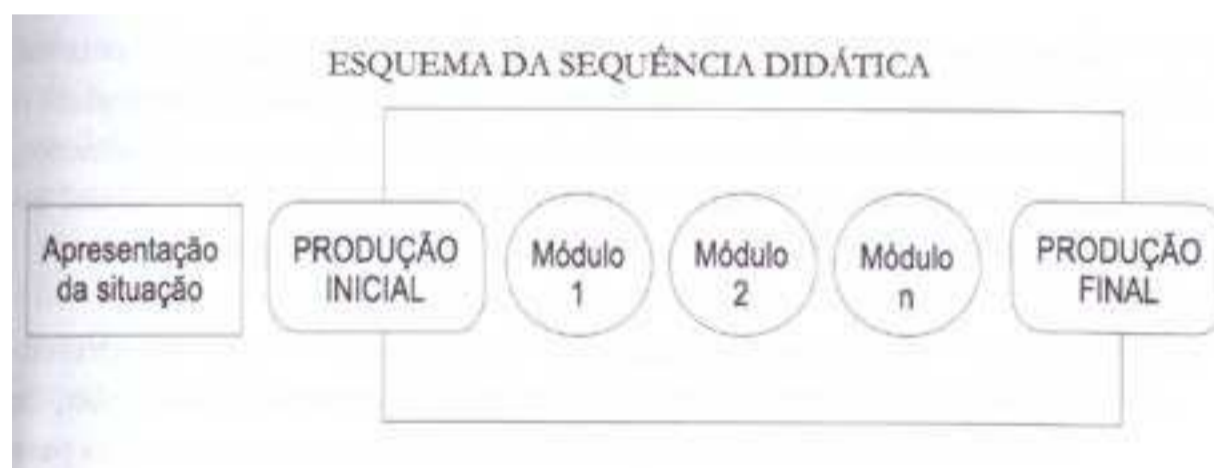
Figura 1 – Esquema da Sequência Didática

Na apresentação de sua proposta metodológica, os referidos autores expõem, em um quadro que reproduzimos a seguir, uma síntese da sequência didática.