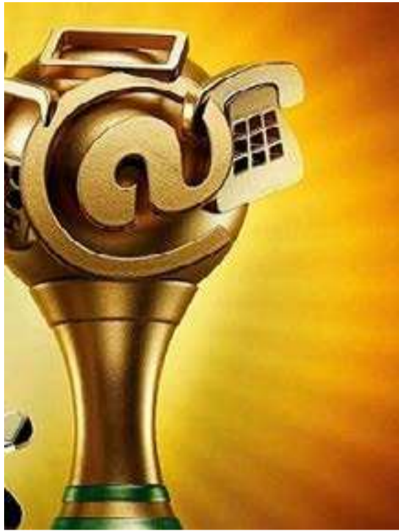
Figura 4 Veja 2322 (22/05/13, p. 51)