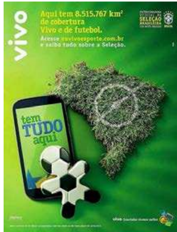
Figura 5 Veja 2322 (22/05/13, p. 52)