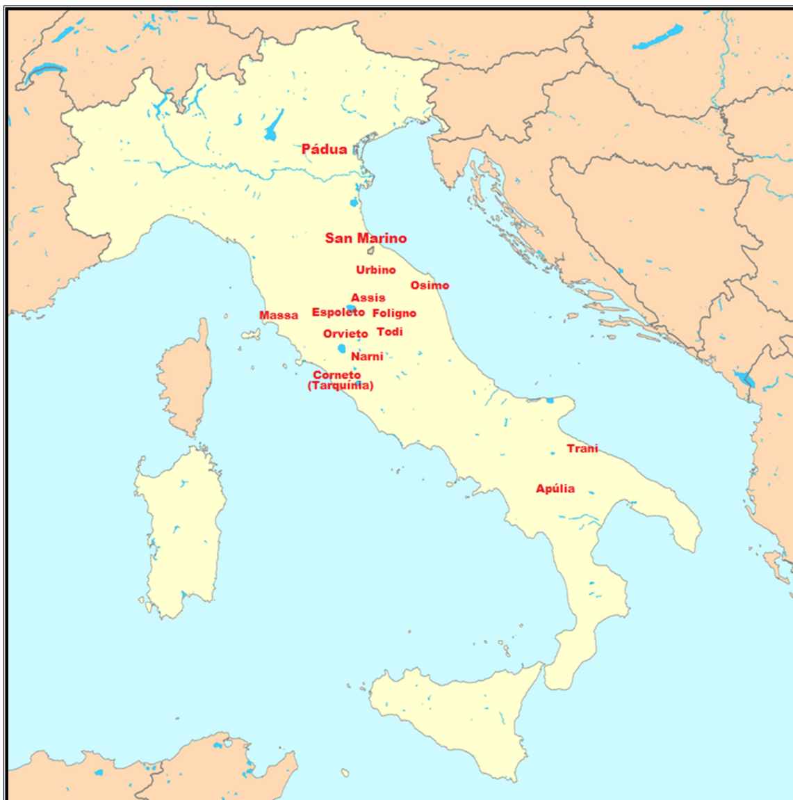
Mapa 1: A localização, feita por nós, das cidades ou regiões onde aparecem os frades relatados no Dialogus .

(Fonte da imagem: Wikimedia . Disponível em: