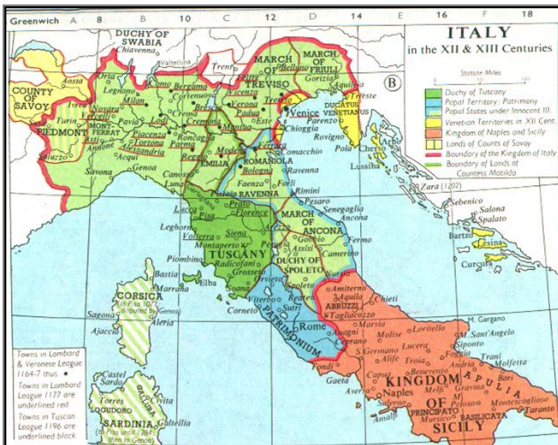
Mapa 2: Itália nos séculos XII-XIII. Corneto e Orvieto encontram-se no alto da área em azul, identificada pelo mapa como Patrimônio de São Pedro (Fonte: Universidade de Fordham . Disponível em: http://www.fordham.edu/halsall/sbookmap.asp . Acesso em 25 nov 2014).