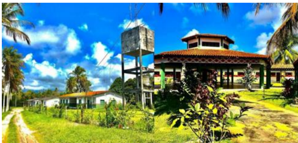
Figura 4: Imagem das escolas da aldeia Barra Velha