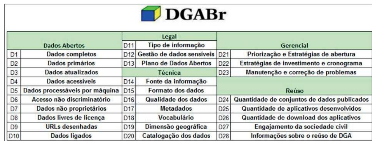
Quadro 2. Resumo da Métrica DGABr.

Ressalta-se que a construção da métrica DGABr é resultado de uma ampla pesquisa que considerou legislações, métricas, modelos e indicadores sobre dados abertos e DGA nos idiomas português, inglês e espanhol, entre 2009 e 2018. Também foram considerados padrões mundiais para publicação de dados abertos, como os oito