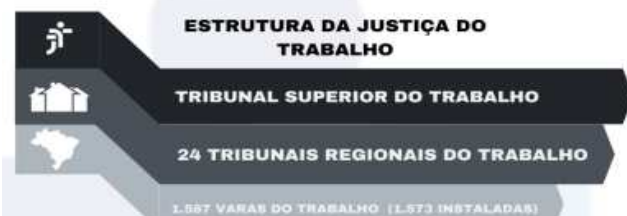
Figura 4.1.1. Estrutura da Justiça do Trabalho. 2021.