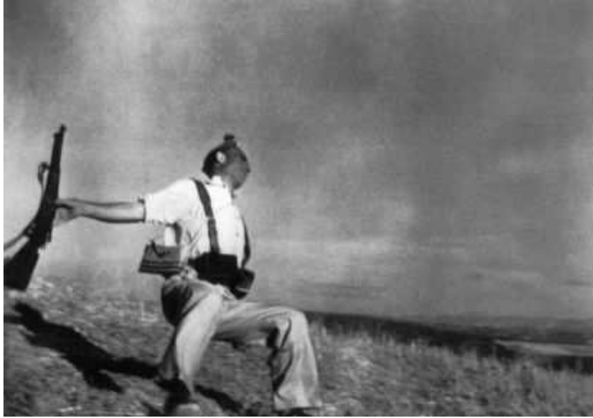
FIGURA I – Soldado Tombando de Robert Capa

Em contraponto, o poema “Cortejo tras la toma de Bilbao”, de César Vallejo, traz a seguinte descrição sobre a notícia da morte de um soldado: