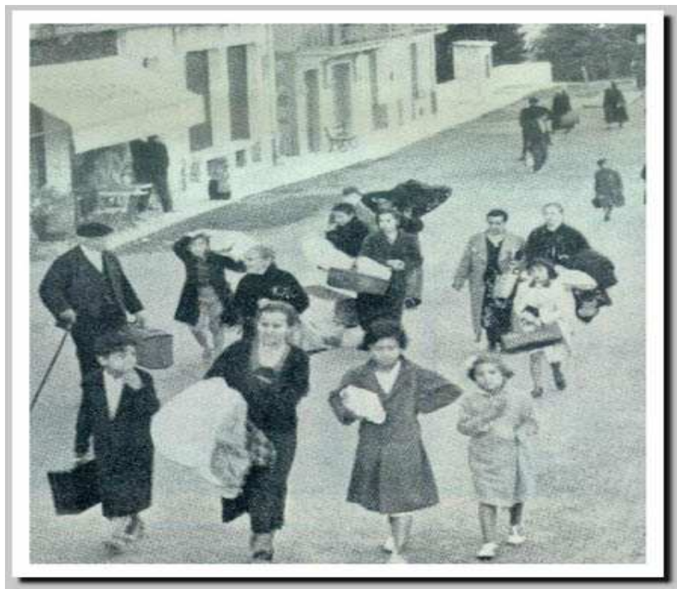
FIGURA V – Abandonando Irún – Origem desconhecida