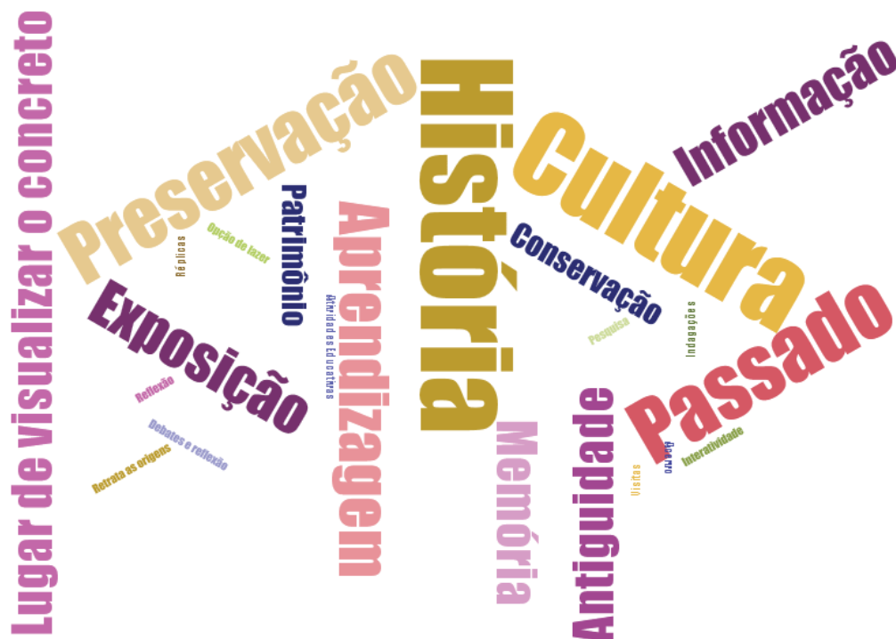
Figura 1: Palavras mais frequentes na definição de museu antes da experiência vivenciada

A concepção de museu que os licenciandos traziam consigo está relacionada a um espaço voltado para o passado, a cultura e a história e que guarda, preserva e expõe objetos antigos. Isso pode ser observado na figura 1.