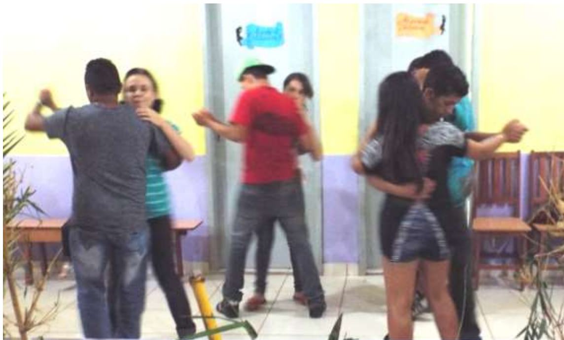
Imagem 07 - Noite Cultural na EFACIL.

Nas escolas urbanas de Itaipé, especificamente a que estou pesquisando, se dedica pouco às atividades culturais, a preocupação maior é em dar conta do conteúdo específico de cada disciplina; o que não entendemos ainda é que a atividade cultural pode ser uma prática dos conteúdos e os educandos apresentarem um melhor rendimento nos estudos. ARROYO (1999, p.25) faz um alerta sobre o currículo urbano: