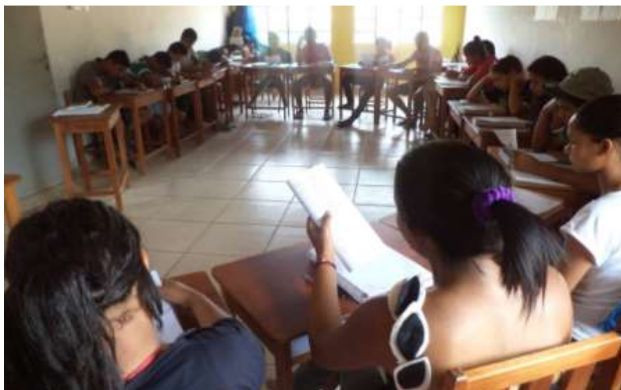
Imagem 1 - educandos organizados em círculo e participando da leitura e discussão do poema na EFACIL.

velórios toda a comunidade se faz presente; entre outras coisas que não consegui anotar. Quando partimos de exemplos que os sujeitos dominam a aula fica participativa e todos animados para realizar as atividades. Assim, quando mostrei a parte que eles não conheciam que eram os poemas, a curiosidade já havia sido despertada de uma forma muito próxima da realidade deles. No decorrer das aulas fui percebendo que o conhecimento é construído de forma coletiva, aproveitando as experiências de vida dos sujeitos para depois aprofundar naquilo que não lhes são familiar. E isto não é tão simples quanto parece. A educação que presenciamos nas escolas públicas é conteudista e preocupada com as avaliações externas, o que não deixa de ser importante, mas não tem alcançado a criatividade, a partilha de conhecimentos e a participação dos nossos educandos. CALDART (2000, p.89) afirma que o educador precisa tornar as práticas mais educativas e humanizadoras e precisa também “construir um jeito de educar que ensine seus educandos (sejam crianças, jovens, adultos...) a se ver nestes processos formadores, a se ver como sujeitos que podem transformar sua realidade...”