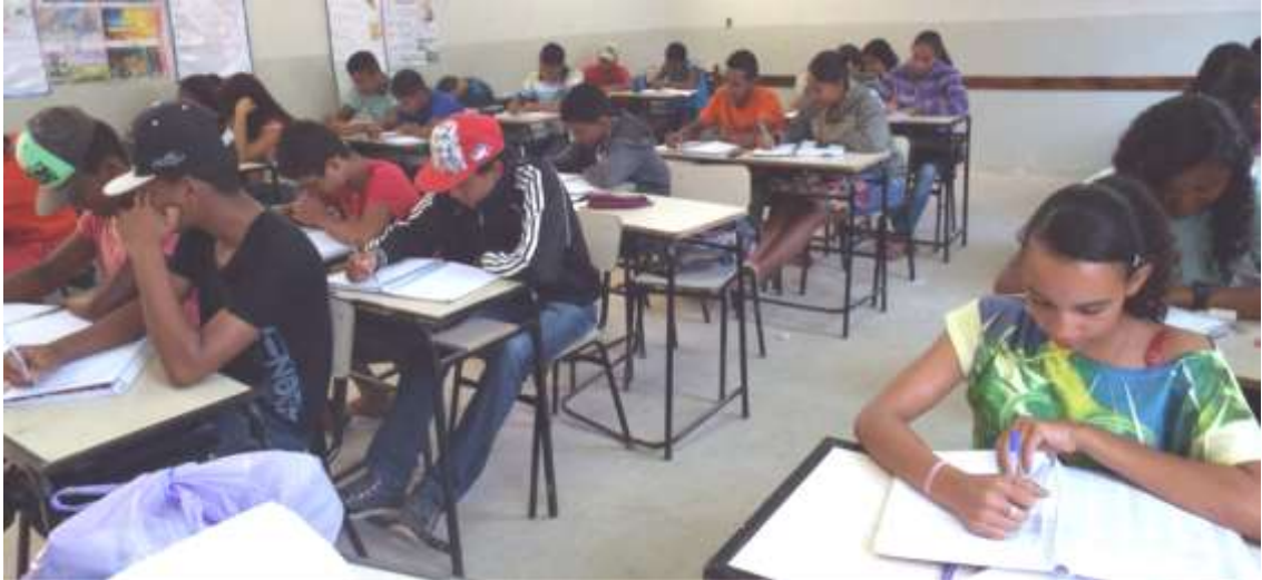
Imagem 4 – Educandos da Escola Pública em fila tradicional, produzindo as atividades. Num segundo momento formaram duplas para lerem o trabalho do colega.