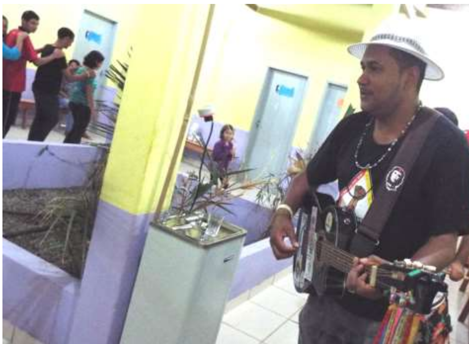
Imagem 5 - Noite Cultural na EFACIL.

povo camponês, Farinhada se apresenta com muito orgulho da sua pele e do seu povo.