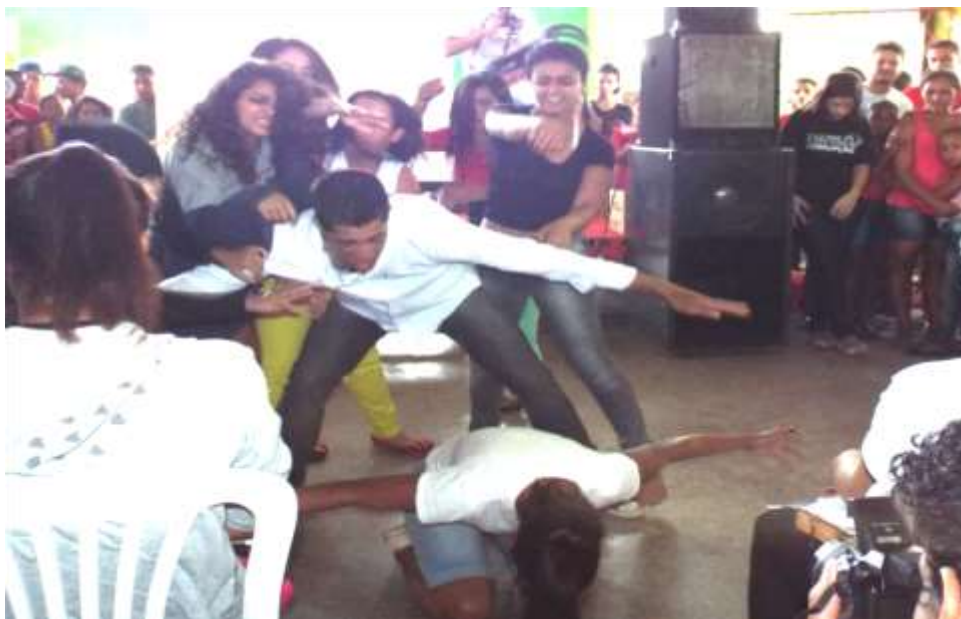
Imagem 08 - Peça Teatral

Foi realizado o Ministério Público Itinerante no Mercado de Itaipé e a escola foi convidada a participar com a apresentação de uma atividade cultural. A professora de Educação Física já havia selecionado um grupo de meninas que se preparavam quando era necessário. Fui convidada a ajudar nos ensaios e observei que as educandas moravam na área urbana, então perguntei por que não havia nenhuma moça do campo na atividade, já que a maioria dos estudantes da escola são da área rural? A resposta foi porque tinham vergonha, não queriam, não gostavam. Então, fui investigar nas minhas turmas. Elas responderam que nunca foram convidadas, a não ser quando era para festa junina, no ensaio de quadrilha. Mesmo com o ensaio em andamento consegui incluir duas meninas no grupo que ficaram muito animadas. Acho, que de maneira inconsciente, provocamos a exclusão dentro da própria escola. Essa ideia defendida por muitos de que o campo é mais atrasado, é o lugar do Jeca, do menino da roupa rasgada, do estudante que não aprende, refleti na atitude de muitas pessoas na sociedade, inclusive na escola. FERNANDES (1998), CERIOLI (1998) E CALDART(1998) afirmam: