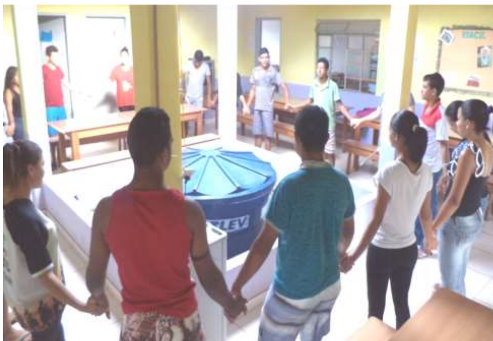
Imagem 3 – Oração que precede as alimentações.

Após a produção dos poemas, ao final de três aulas, os educandos foram para o pátio central da EFACIL e fizeram um círculo. Para mim, foi como se fosse a conclusão de uma proposta de trabalho que falava de vivência, costumes e solidariedade na comunidade.