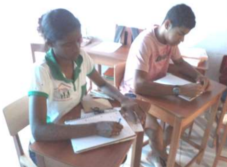
Imagem 2 - Produção das atividades. Fonte: Arquivo Pessoal A Solidariedade na Minha Comunidade