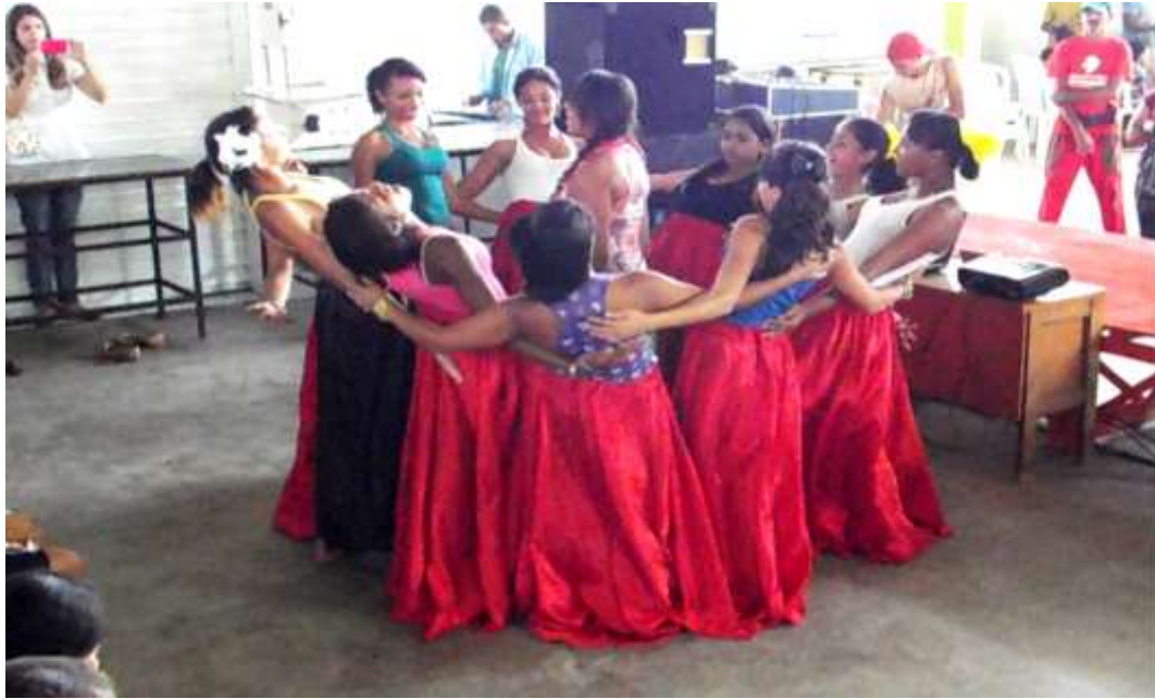
Imagem 15 - Apresentação de Dança.