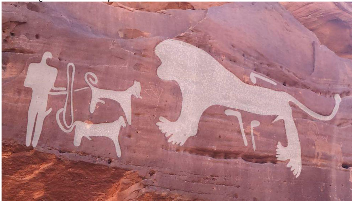
Figura 1: Homem caçando um leão com o auxílio de dois cães