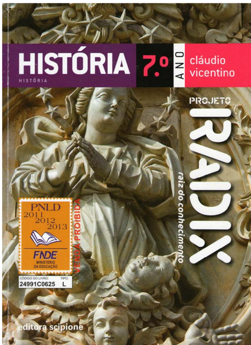
Figura 1 - Capa do livro destinado ao 7º ano da coleção Projeto Radix.

Os capítulos do livro do sétimo ano estão assim organizados: