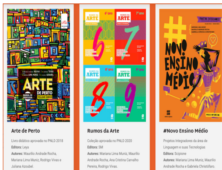
Figura 1 – Capas das três coleções didáticas aprovadas pelo Arte em Conexão.

Na elaboração dos materiais didáticos, fez-se necessário um estudo das políticas públicas e legislações pertinentes, tais como Editais do Plano Nacional do Livro Didático – PNLD, Lei de Diretrizes e Bases da Educação – LDB e suas leis complementares, Base Curricular Nacional Comum – BNCC, Lei do Ensino Médio, entre outras. Além disso, analisamos os materiais didáticos já produzidos para essa finalidade aprovados pelo PNLD e outros materiais utilizados em escolas privadas, bem como realizamos uma revisão bibliográfica extensa sobre o ensino de Artes Visuais, Dança, Música e Teatro no contexto escolar. A partir desse estudo, elaboramos uma estrutura que permita o desenvolvimento dos objetos de conhecimento previstos na BNCC e sua seriação de acordo com cada etapa do Ensino Fundamental ou Ensino Médio. Essa estrutura é submetida à aprovação da Editora parceira e procedemos à escrita das coleções que contêm livro do aluno, manual do professor, áudios de música e Objetos Digitais de Aprendizagem como vídeos, jogos e descrição de práticas pedagógicas. O Arte em Conexão possui materiais aprovados em diferentes editais PNLD, conforme Fig.1.