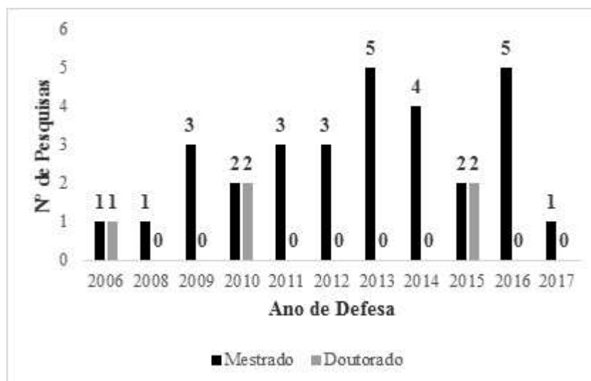
Gráfico 2 – Número de pesquisas por ano de defesa

O gráfico 2 discrimina as pesquisas por ano de defesa.