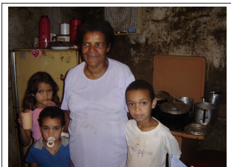
FIGURA 6 - Natividade – descascadeira de alho

No dia seguinte, 15 de julho de 2004, quinta-feira, lá estava eu, de volta à periferia de Sete Lagoas. Dessa vez, eu pretendia reunir três descascadeiras de alho levando uma delas até o bairro das outras duas. Essa entrevista, em especial, não era uma certeza, mas uma possibilidade, porque, na época, a fábrica de tempero estava parada por falta de verba para a