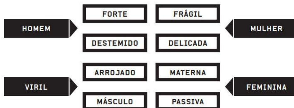
FIGURA 2 – CARACTERÍSTICAS MASCULINAS E FEMININAS E OS PADRÕES HIERARQUIZADOS