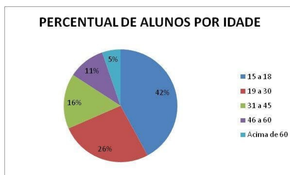
GRÁFICO 2 – PERCENTUAL DE ALUNOS POR IDADE DA EJA EXTERNA DO CENTRO CULTURAL MARIA GORETE