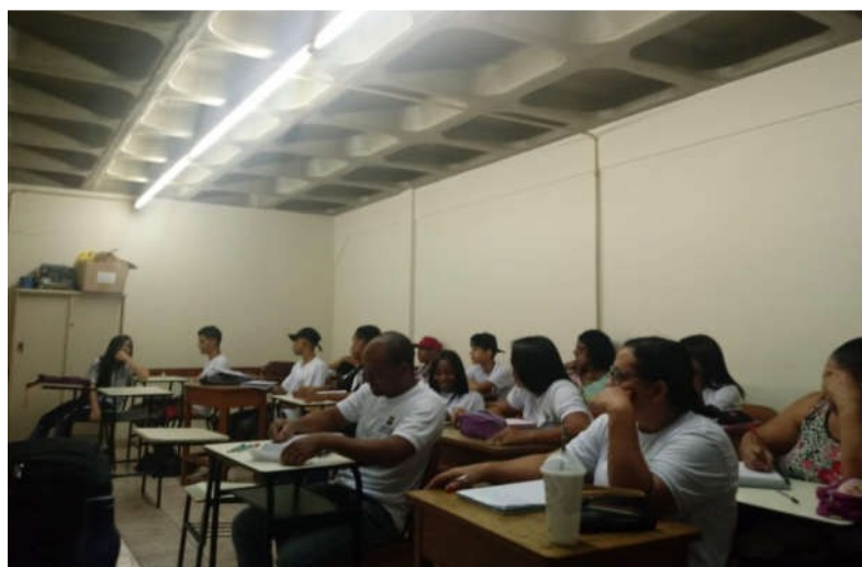
FIGURA 1 – SALA DE AULA DA EJA EXTERNA CENTRO CULTURAL MARIA GORETE