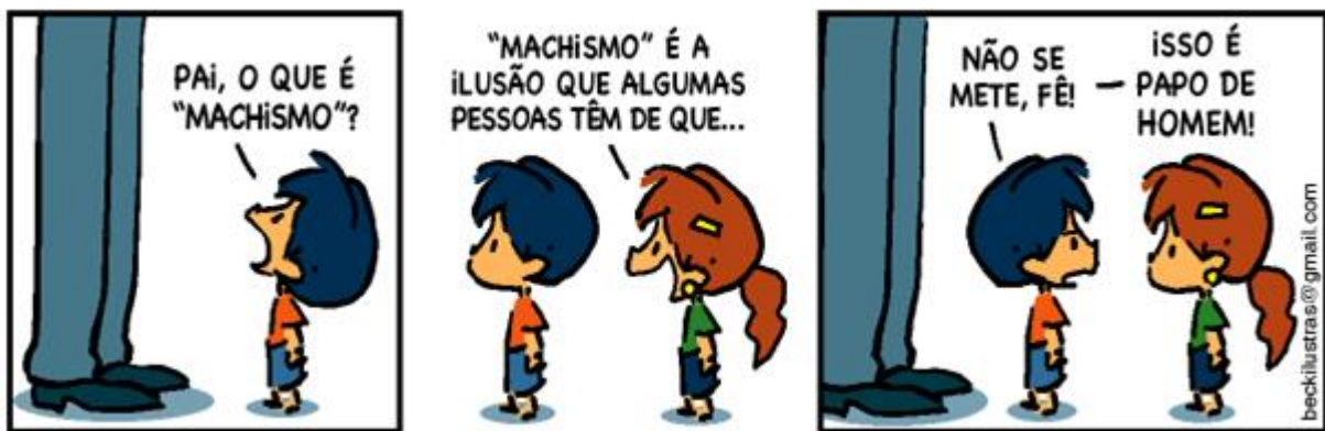
Imagem 08: tirinha