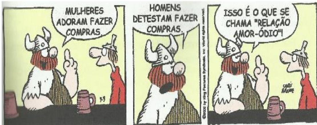
Imagem 01: Tirinha