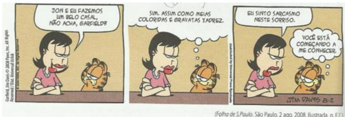
Imagem 10: tirinha

Fonte: Sette et al , v. 03, 2013, p. 54.