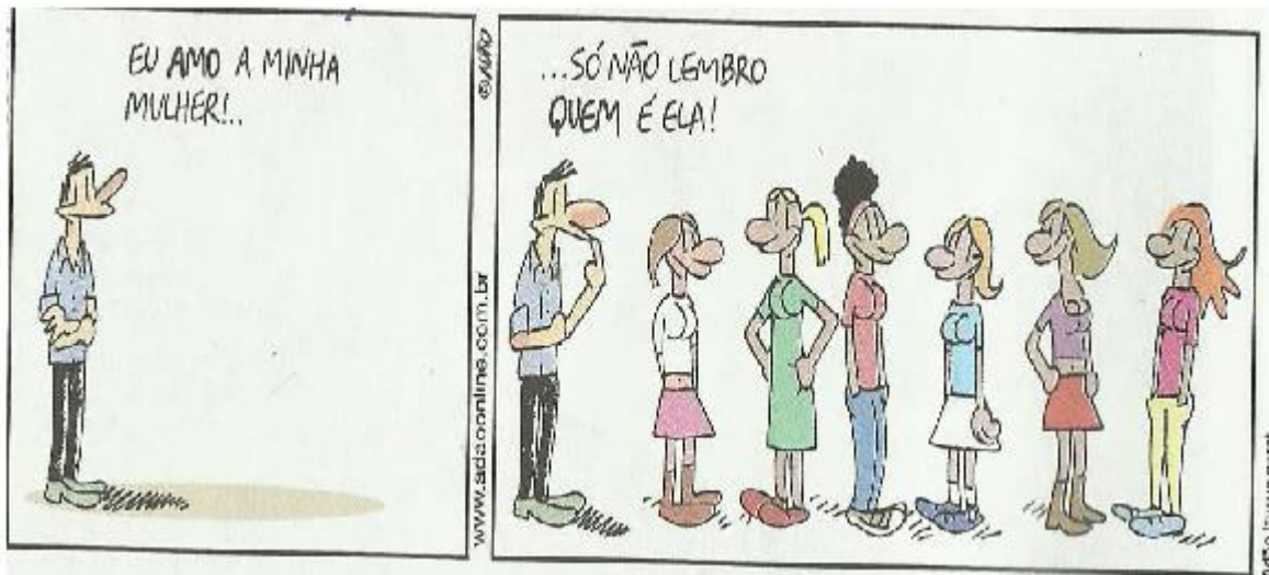
Imagem 07: tirinha

Fonte: Sette et al , v. 03, 2013, p. 56.