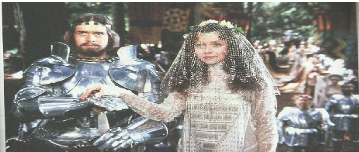
Imagem 15: fotografia

Fonte: Sette et al , v. 02, 2013, p. 32.