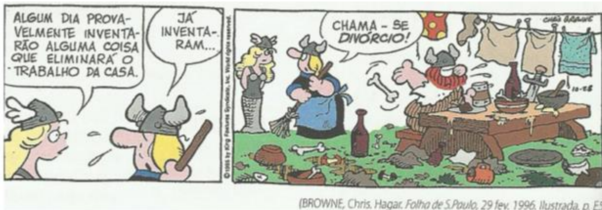
Imagem 14: tirinha