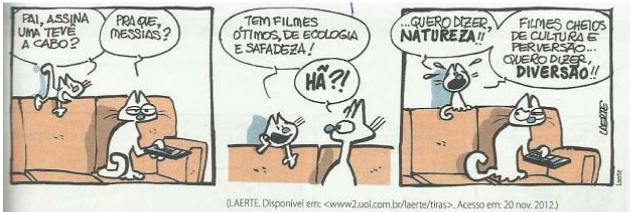
Imagem 12: tirinha