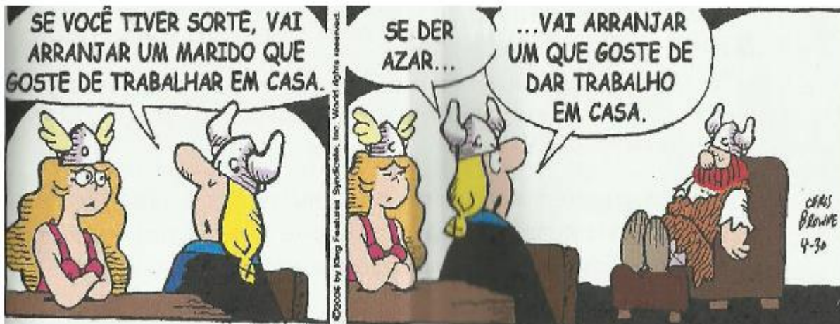
Imagem 03: Tirinha