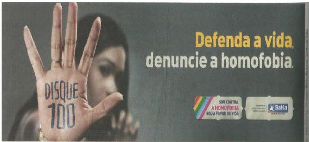
Imagem 05: outdoor