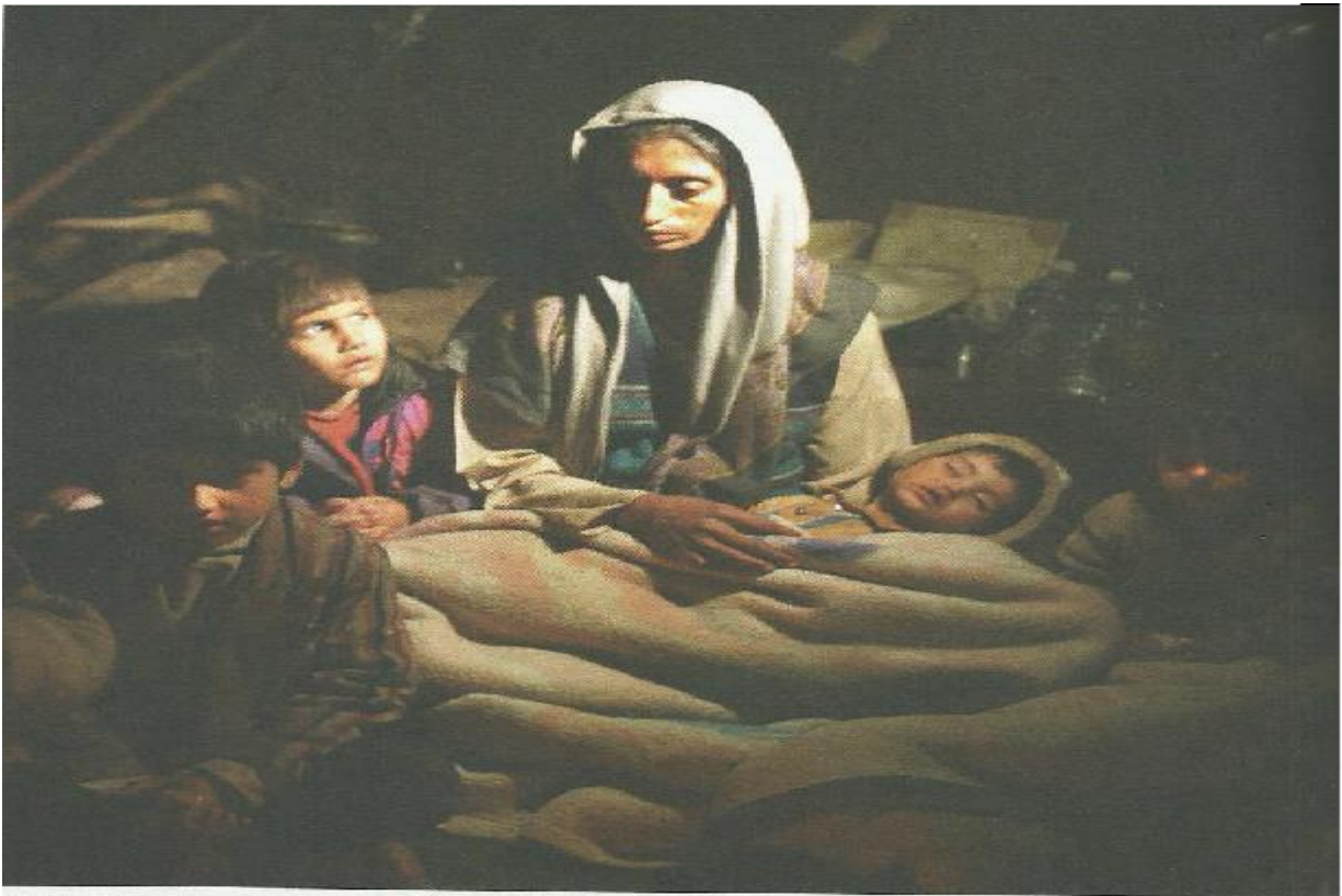
Pietà. Mãe e filhos em abrigo de Uri, uma das cidades da Índia mais afetadas pelo tremor de terra de sábado; tempestade na fronteira com o Paquistão dificulta trabalho de resgate. (Folha de S.Paulo, 12 out. 2005. Capa.)

Fonte: Sette et al , v. 01, 2013, p. 56.