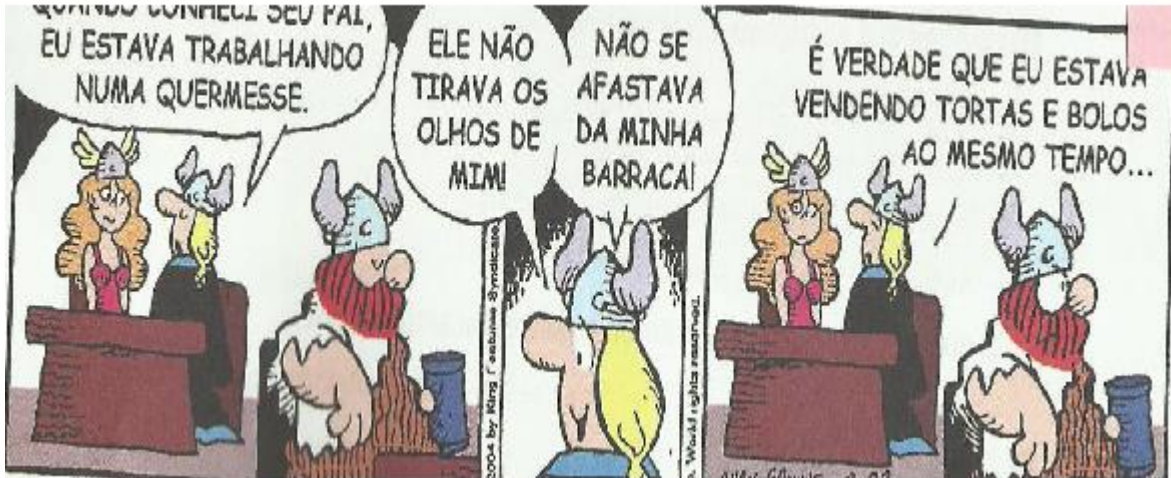
Imagem 02: Tirinha

Analisemos a próxima imagem do livro didático (gênero textual Tirinha)