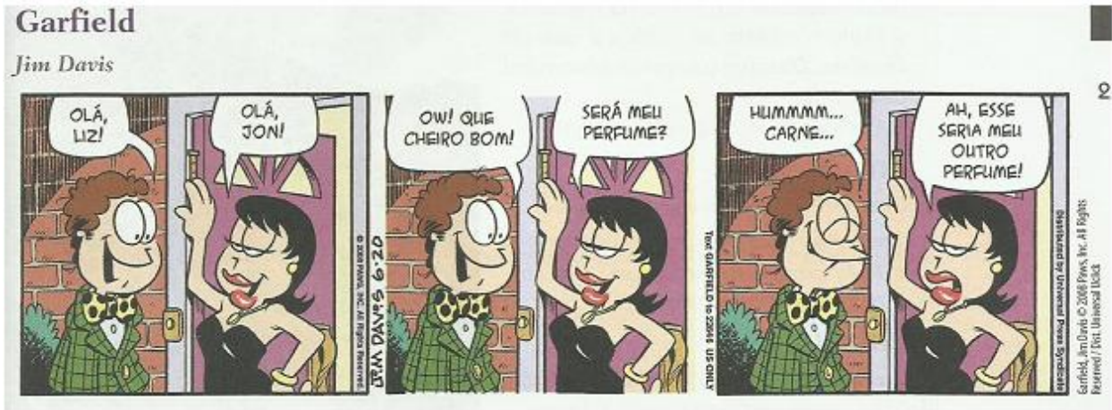
Imagem 11: tirinha