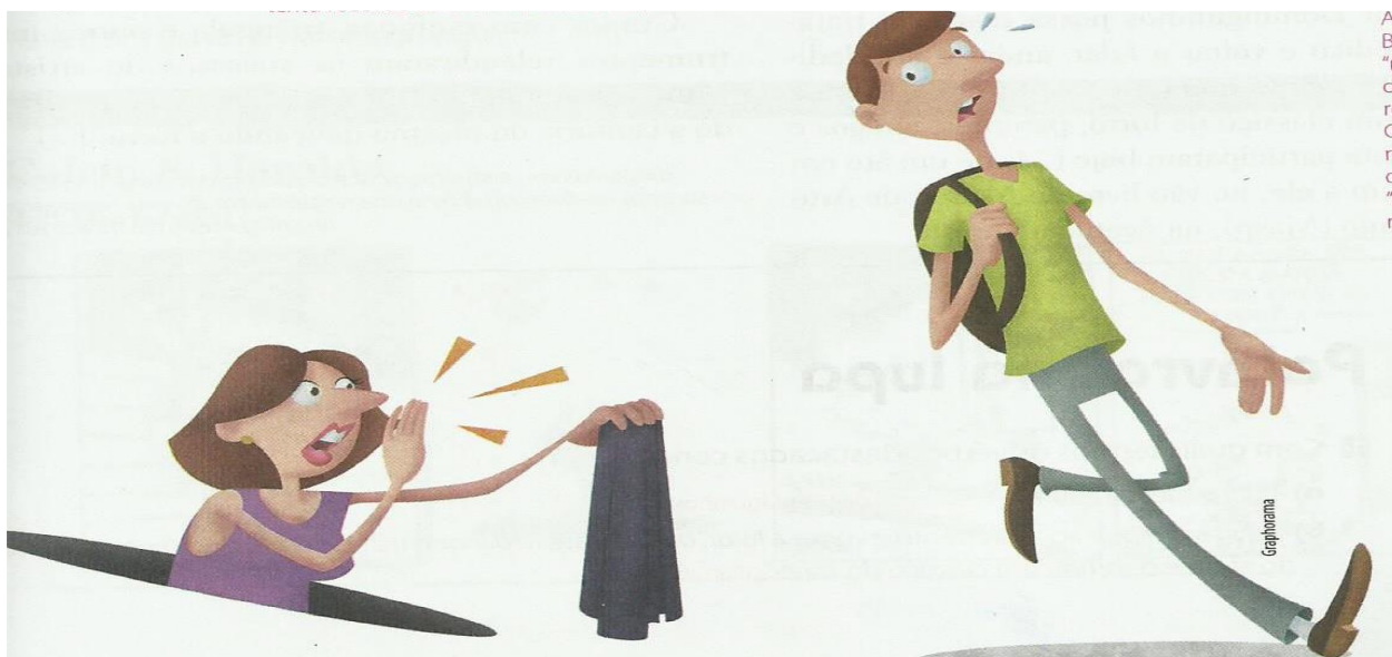
Imagem 09: ilustração