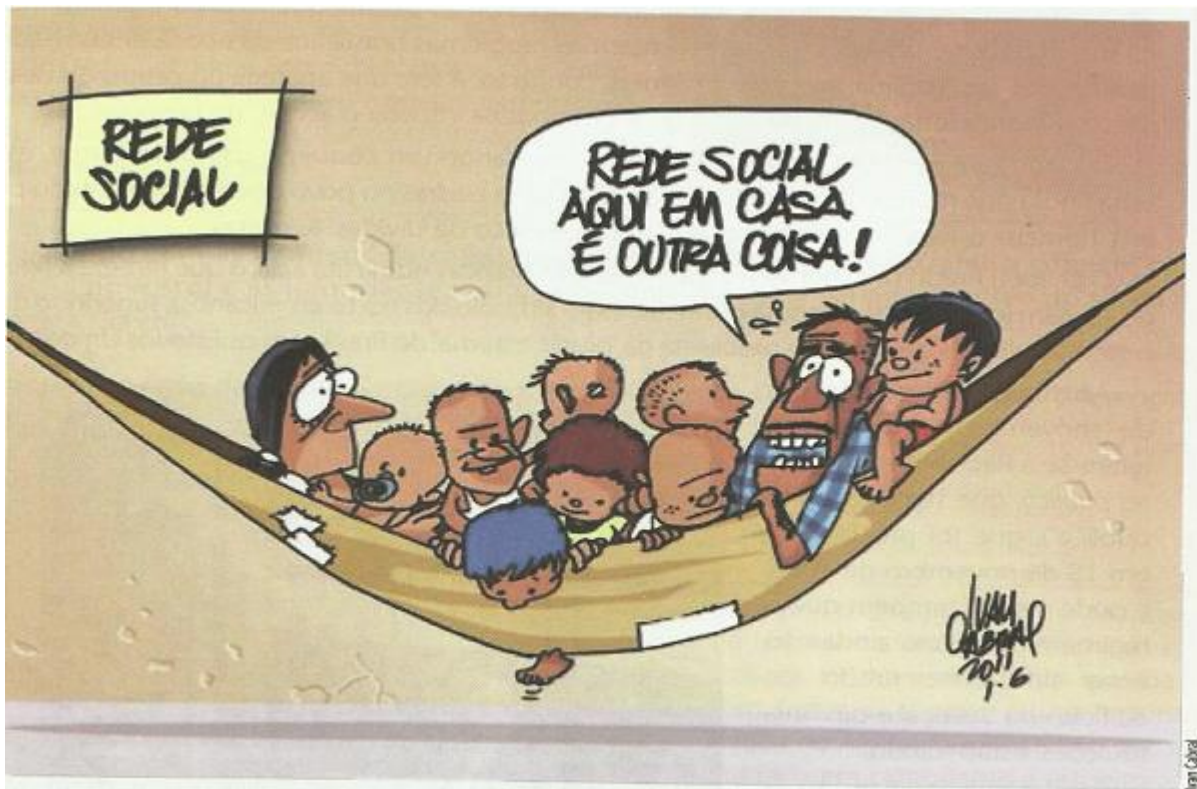
Imagem 13: charge

Fonte: Sette et al , v. 03, 2013, p. 95.