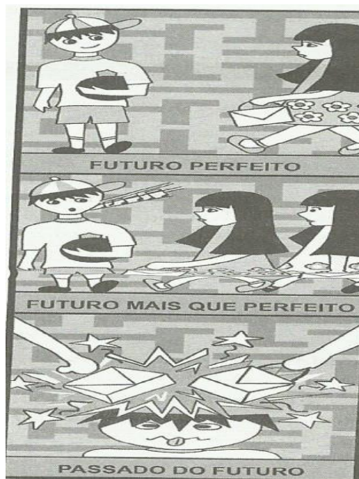
Imagem 04: tira

Fonte: Sette et al , v. 03, 2013, p. 102