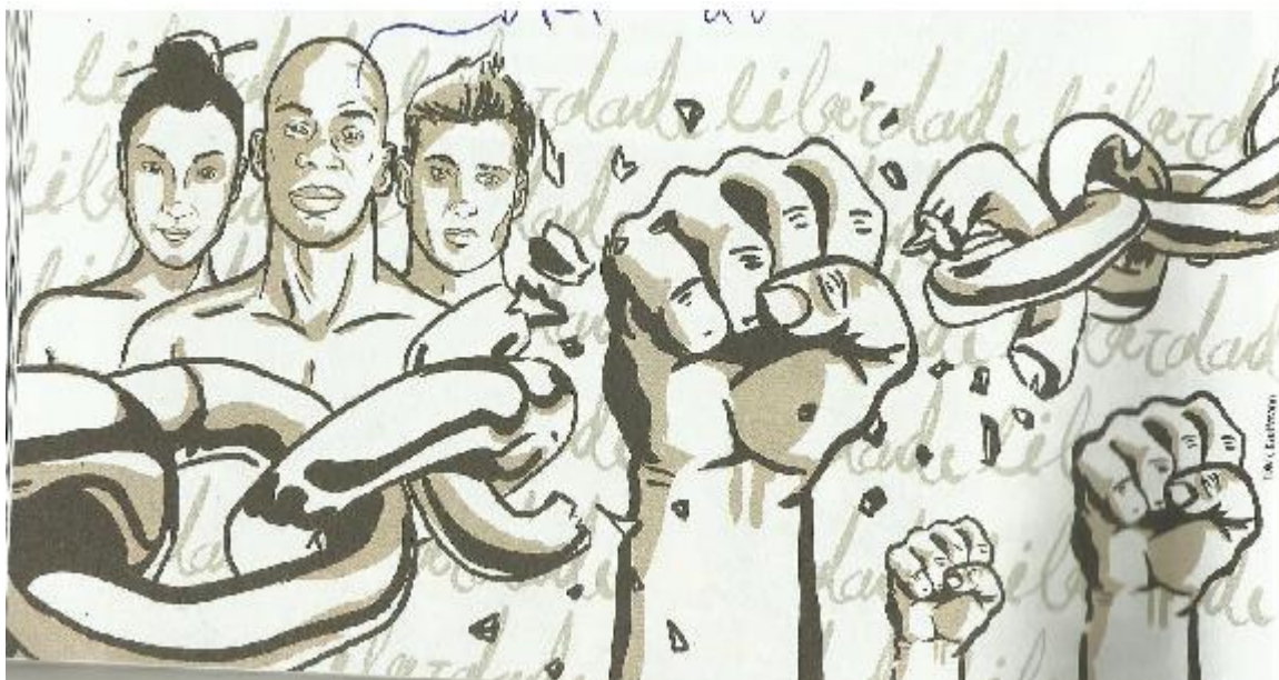
Imagem 06: obra artística