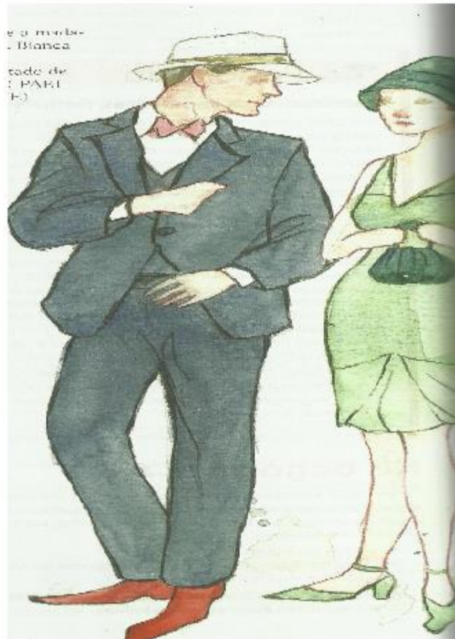
Imagem 17: ilustração