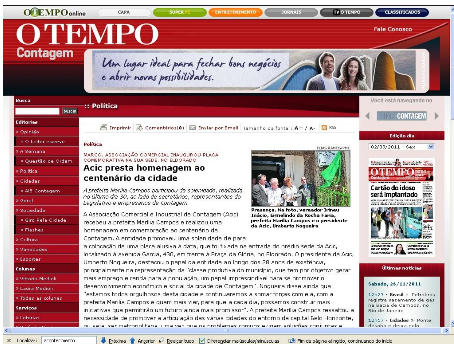
Figura 2 – Matéria publicada no site do jornal O Tempo Contagem