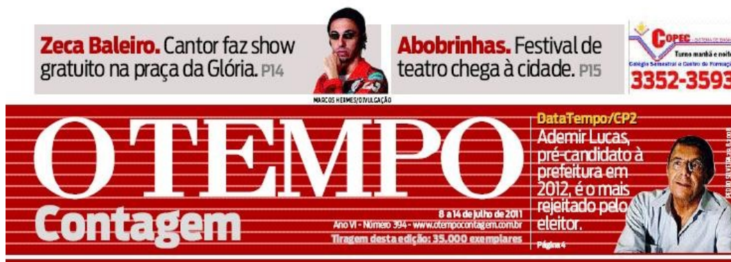
Figura 2 – Chamadas do jornal O Tempo Contagem – edição 8/7/2011