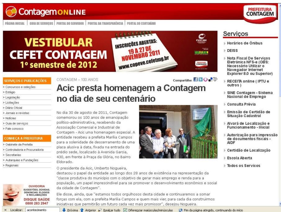
Figura 1 – Matéria publicada no site da Prefeitura de Contagem