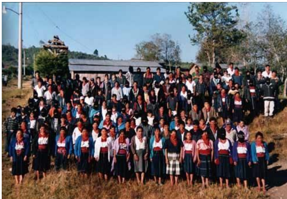
Escola secundária do caracol Oventik.