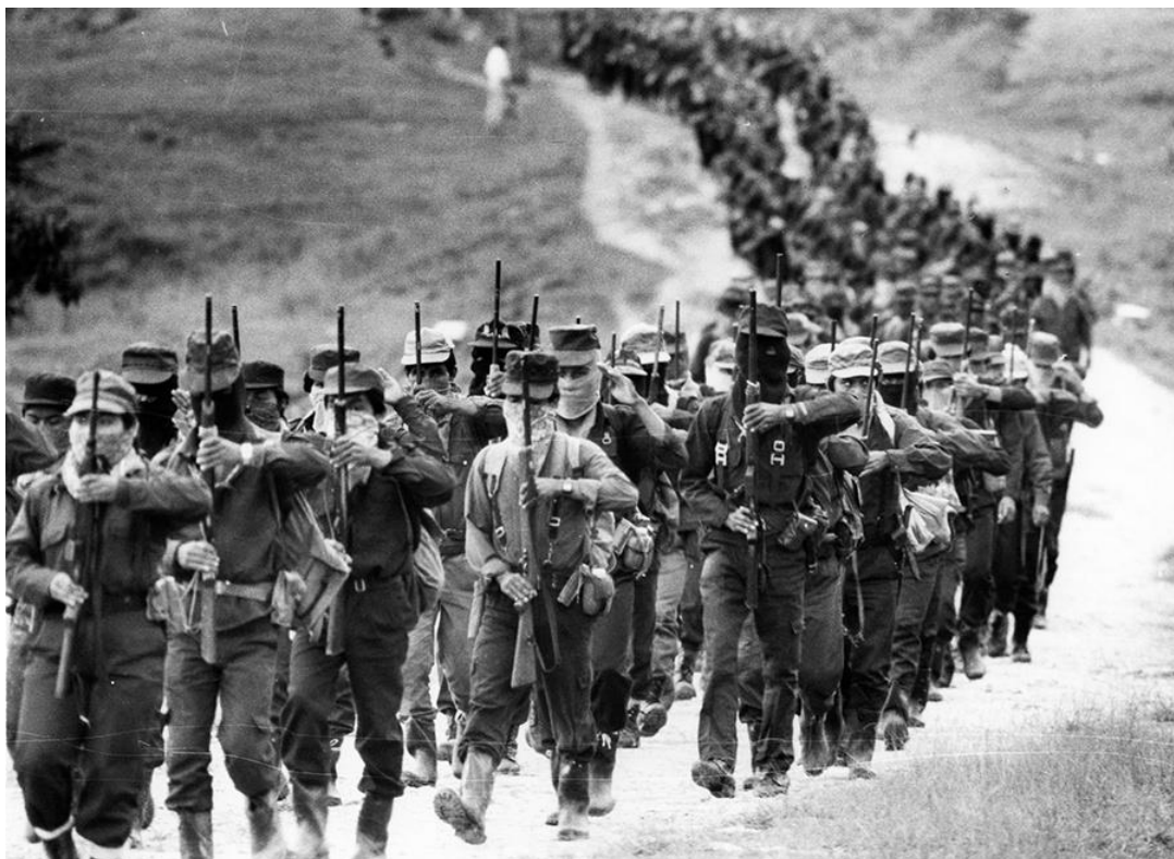
Índigenas zapatistas armados e uniformizados.