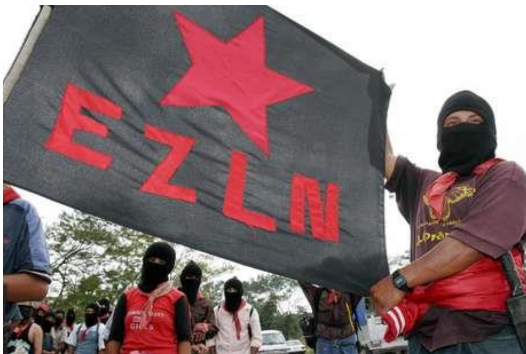
Bandeira zapatista preta com estrela vermelha.