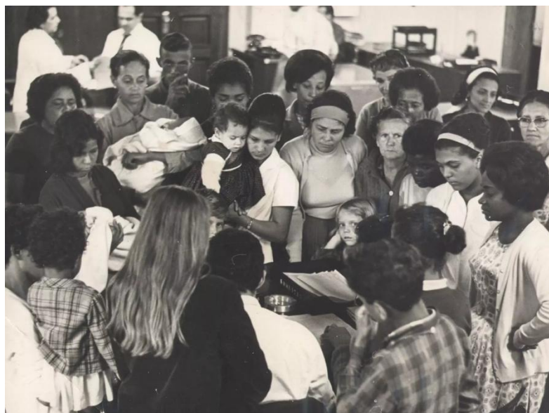
Figura 5 - Esposas de presos políticos

Para isso, foram selecionadas sete fotografias como fontes históricas deste período, encontradas nos sites Memórias da Ditadura, Ensinar História e Café História.