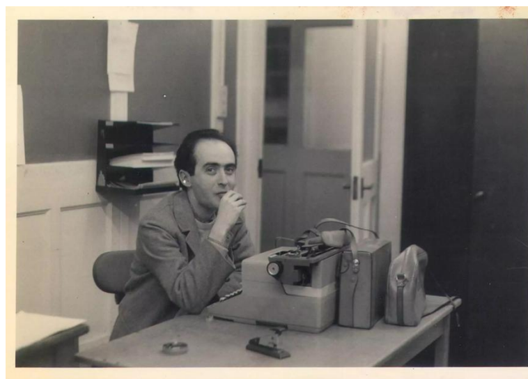
Figura 9 - Jornalista Vladimir Herzog em 1966