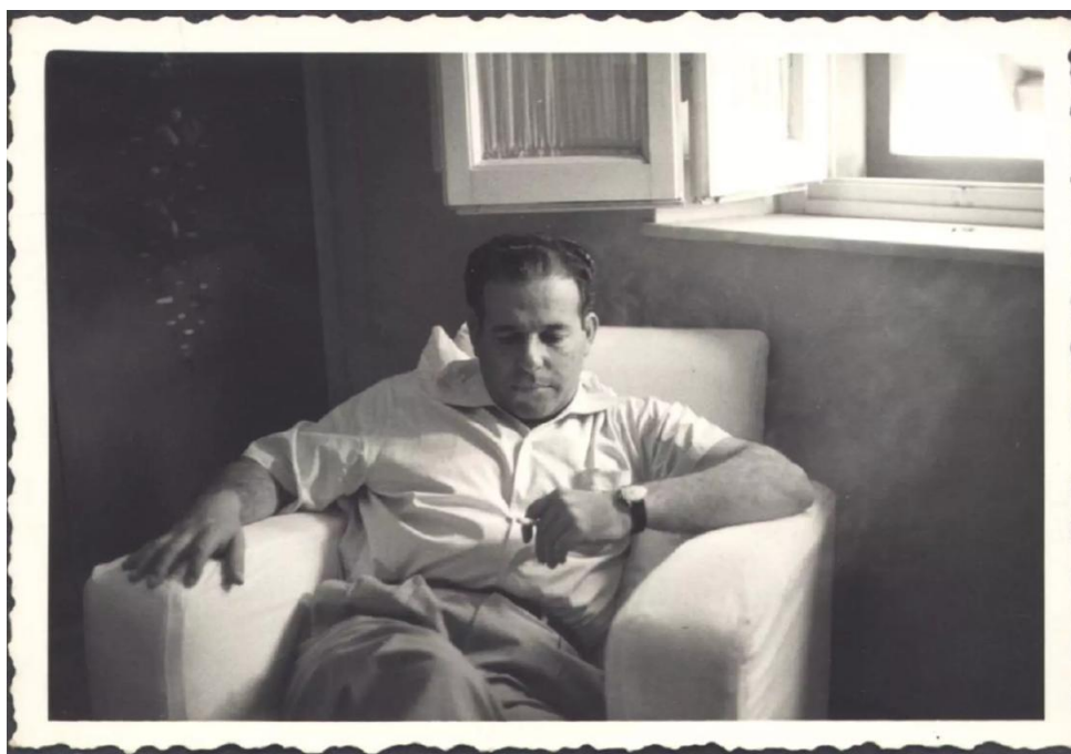
Figura 6 - O presidente João Goulart no exílio no Uruguai