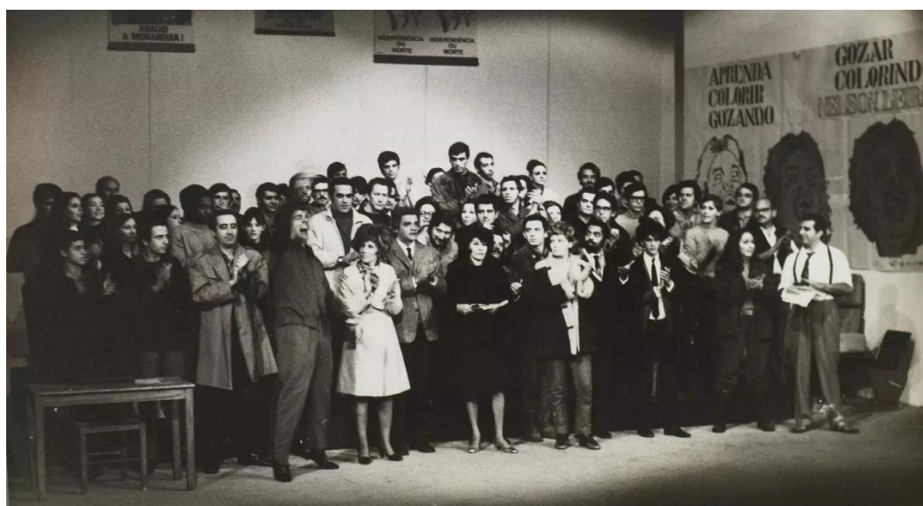
Figura 7 - Artistas protestam contra a censura aplicada ao teatro brasileiro