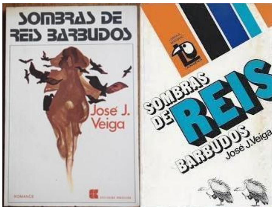
Figura 1 - Edições da década de 1970.

4º momento: Projeção das capas dos livros e proposição de reflexões sobre as imagens e suas possíveis relações com título da obra;