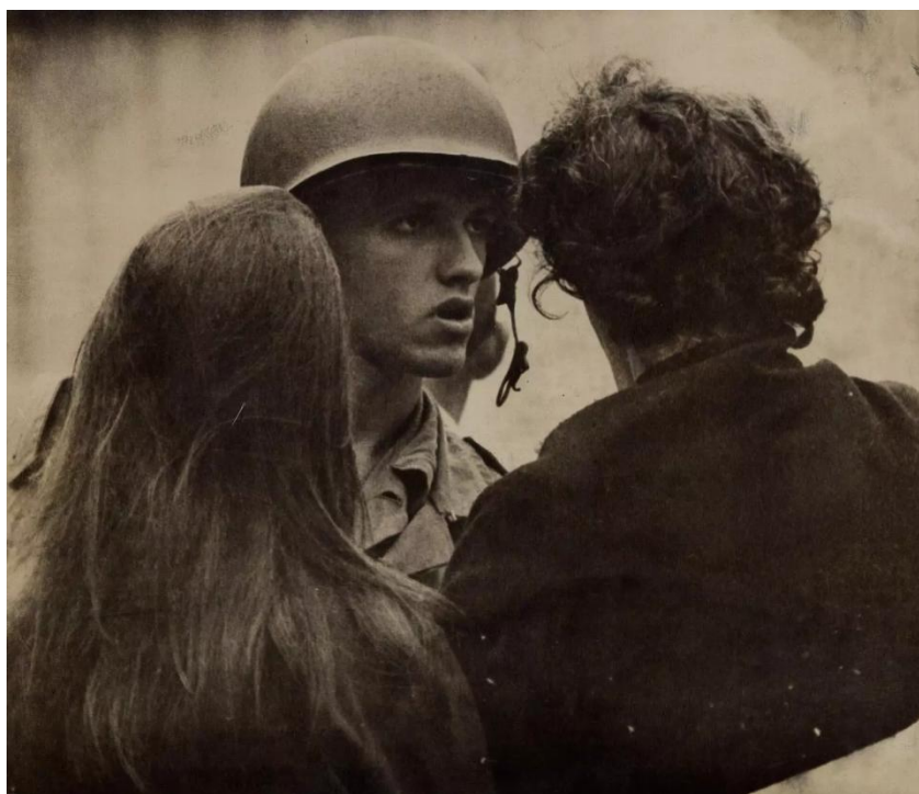
Figura 8 - Soldado em ação durante o 1º de abril de 1964