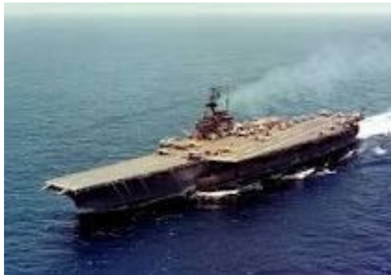
Figura 11 - Porta-aviões na Operação Brother Sam