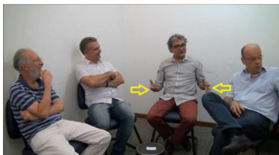
B2: o quê que *É