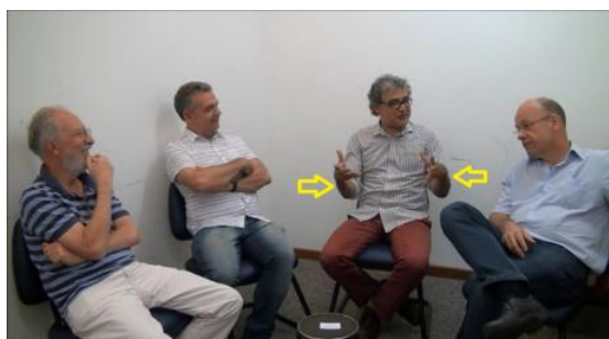
o jei T Inho; (.) cÊ en T ENdi,