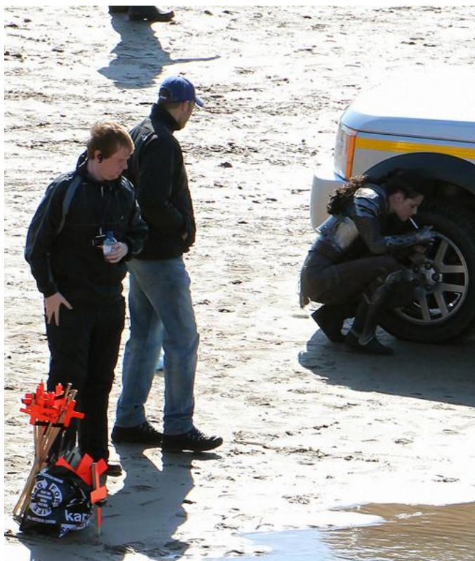
Figura 5 – A atriz Kristen Stewart fuma durante a gravação do filme “ Snow white and the huntsman ”, exemplo de self íntimo transgressivo