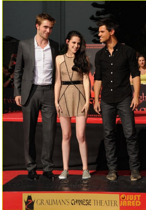
Figura 3 - Participação de Kristen Stewart com seus colegas de elenco do filme Crepúsculo em uma cerimonia em que registraram a marca de suas mãos e pés na calçada de um teatro chinês. Exemplo do self público.