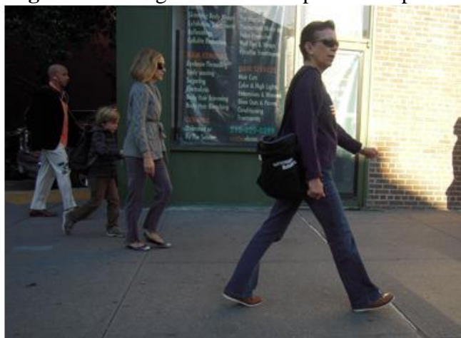
Figura 1 – Fotografia realizada por uma repórter

A fotografia da repórter (Figura 1) mostra algo aparentemente insignificante, não é possível nem mesmo distinguir o que está acontecendo na cena em que vários pedestres se movimentam pela cidade. Na imagem registrada pelo paparazzo , porém, é impossível não notar a personalidade, que é perfeitamente recortada da cena da cidade. Sarah Jessica Parker aparece de mãos dadas com o filho, sendo possível ver com clareza cada detalhe de seus figurinos e até mesmo veias protuberantes de sua mão (Figura 2).