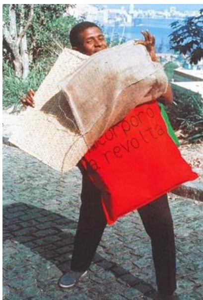
Imagem 5 - Parangolé capa 15