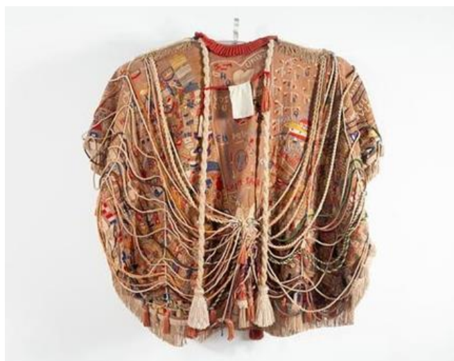
Imagem 2 - Manto da Apresentação.

A imagem 2, Sem título/ Manto da Apresentação, de Arthur bispo Rosário, revela um objeto rico em detalhes com muitas informações visuais, costurado com retalhos de tecidos, linhas, e objetos do cotidiano, ele se apresenta como um inventário da memória do artista e do mundo ao seu redor. O Manto de Bispo pode ser modelo de variadas abordagens criativas em sala de aula por diferentes idades, explorando desde as imagens bordadas apenas como composição visual a trabalhar os significados de cada uma delas segundo a percepção do próprio artista. Pode-se trabalhar trajetos que vão estimular a memória dos educandos, pode-se trabalhar também as formas, cores, harmonia entre os espaços e figuras apresentadas. Pode-se também sugerir a produção de histórias inventadas ou narrativas reais. Há uma infinidade de opções, basta somente ser criativo ao propor as atividades.