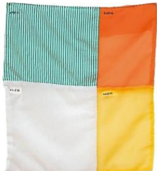
Imagem 7- Cheio e Vazi

A seguir, observe outros trabalhos de Leonilson: