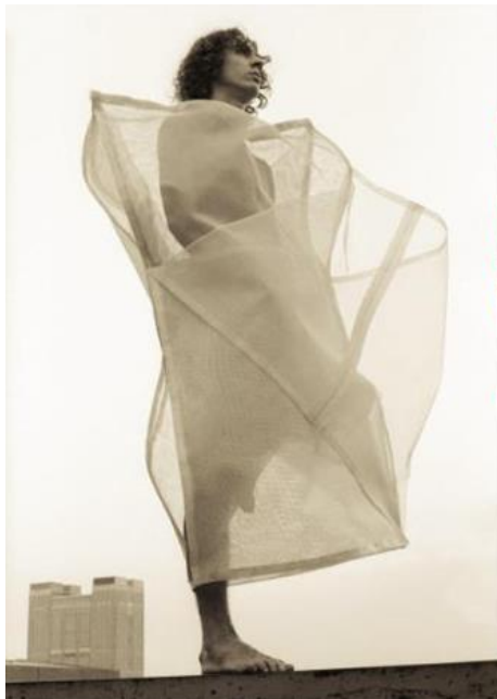
Imagem 4 - Parangolé capa 23