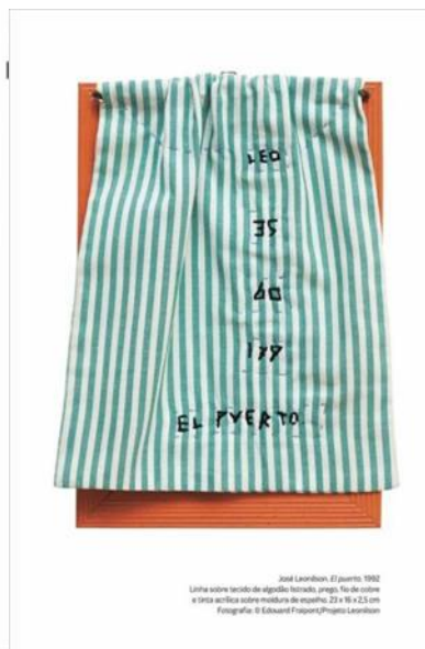
Imagem 8 - El Porto, 1992