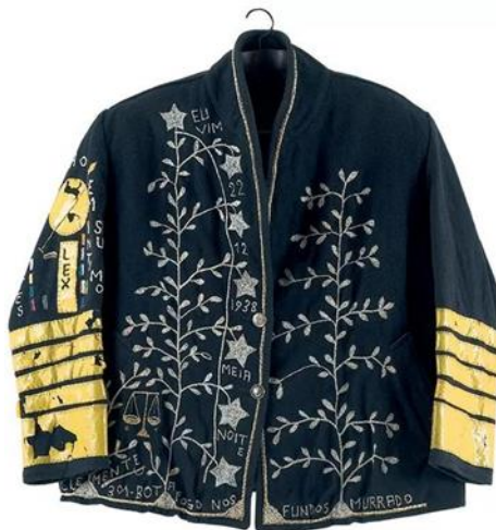
Imagem 3 - Casaco Bordado, remete ao folclore