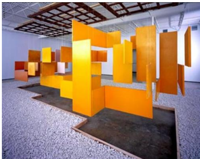
Imagem 1- Grande Núcleo