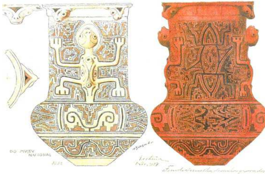
Figura 1 – Urna funerária marajoara.

Não pense, veja! 7 O que Viana vê nas urnas funerárias marajoaras da Figura 1? O que ele vê são padrões simétricos idênticos aos das calçadas portuguesas e aos das cerâmicas mesopotâmicas.