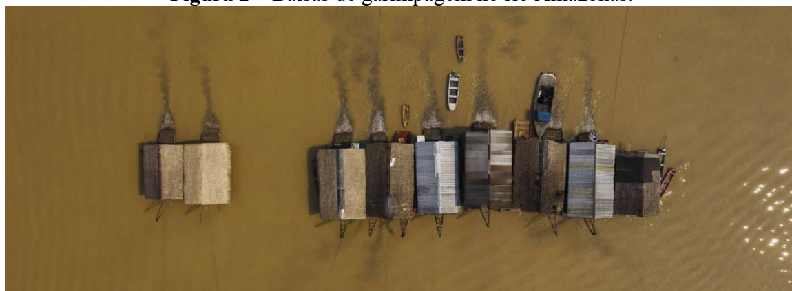
Figura 2 – Balsas de garimpagem no rio Amazonas.

Fonte: https://www1.folha.uol.com.br/ambiente/2020/09/na-terra-de-mourao-garimpo-ilegal-opera-no-am-sob-vista-grossa-do-exercito.shtml