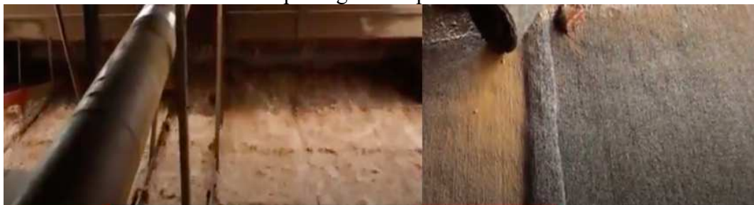
Figura 4 - À esquerda, cascata artificial formada pelos sedimentos pesados extraídos do rio. À direita tapetes grossos que retêm areia e ouro.