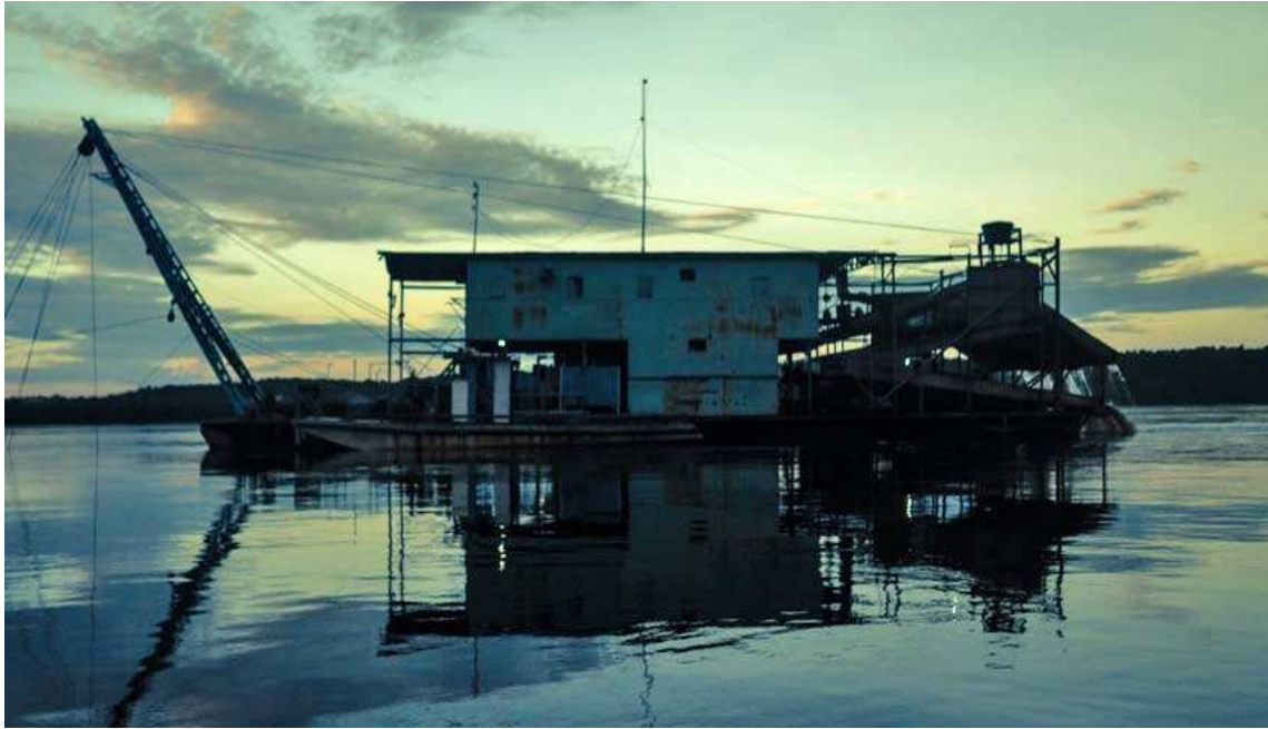
Figura 3 - Balsas usadas na prática da garimpagem