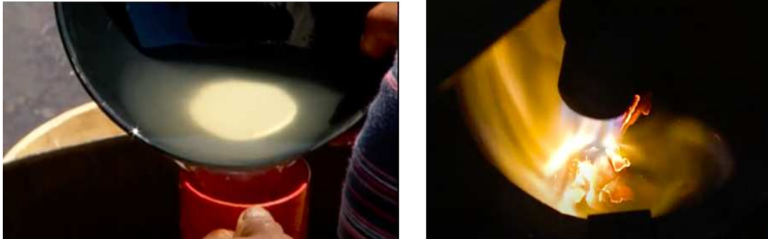
Figuras 6 e 7 - Processo de aderência ao mercúrio à esquerda e a volatilização do mercúrio à direita.