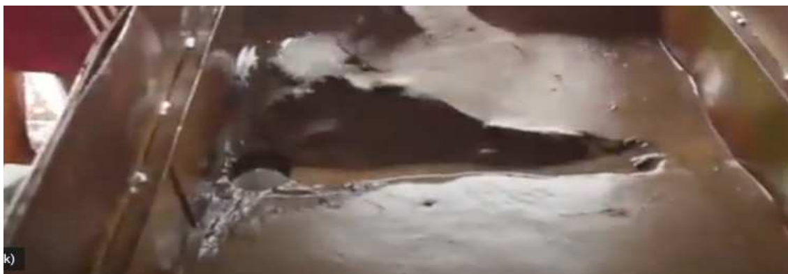
Figura 5 - Tanque de separação do material arenoso da água.