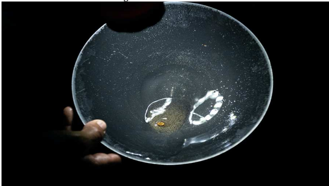
Figura 8 - Ouro na vasilha.