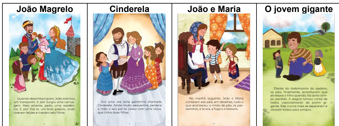
Quadro 2 – Família típica