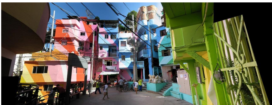
Figura 3 – Pintura na Praça do Cantão, no Santa Marta.

Assim, buscando lidar com o incômodo e o estranhamento da convivência próxima, entre duas realidades tão distintas, vemos surgir a ideia de “invisibilizar” a realidade da favela. Acreditando que a pintura seria capaz de disfarçar ou esconder a precariedade e a pobreza urbana, diversas ações buscaram este caminho. Assim, em 2010, após a conclusão da passarela e centro poliesportivo da Rocinha, com projeto de Oscar Niemeyer, as fachadas das casas em contato com a via foram pintadas em cores vivas (Fig. 2).