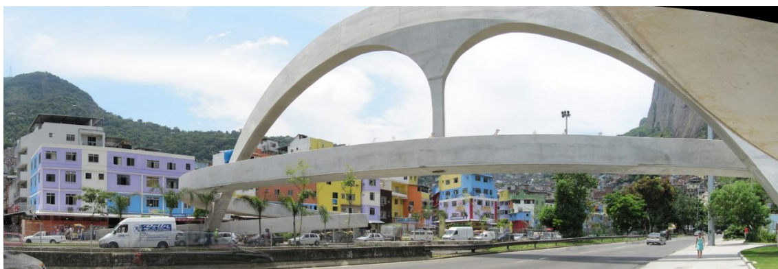
Figura 2 – Passarela da Rocinha com a linha frontal de casas pintadas