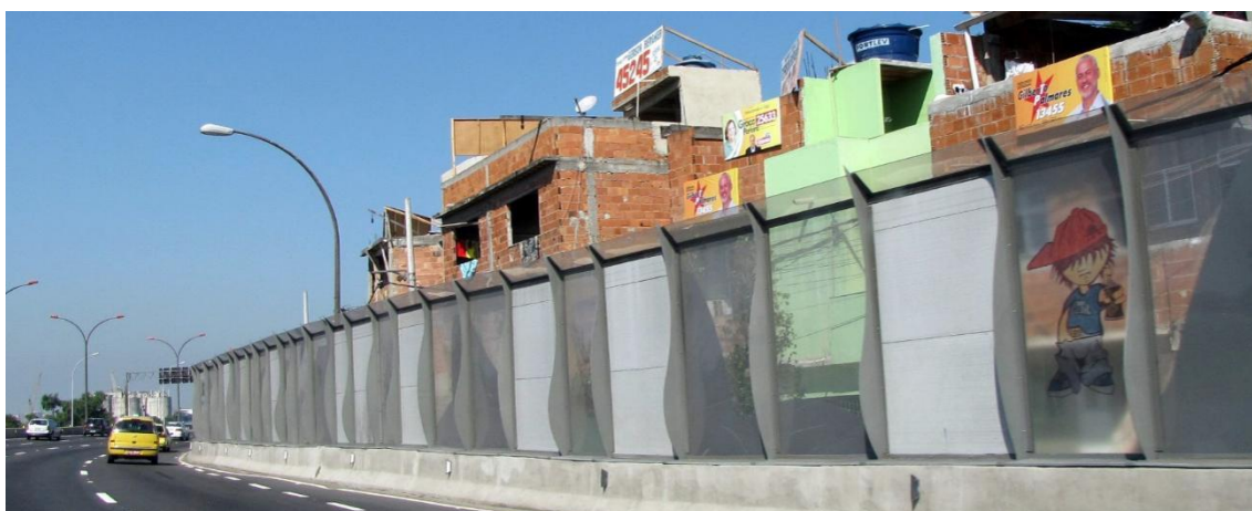
Figura 5 – A “Barreira Acústica”, instalada ao longo da Linha Vermelha.

Não foi a primeira vez que algo assim foi proposto, já no início dos anos 2000, dois projetos de lei propunham a construção de altos muros de concreto entre as vias públicas e as favelas vizinhas, um deles citando especificamente as Linhas Vermelha e Amarela e os trechos vizinhos às favelas. E, apesar do discurso da violência e do risco de assaltos, de balas perdidas e até de atropelamentos para a população, a explícita segregação contida nos projetos ficava evidente e a forte reação da população local fez com que acabassem arquivados (RIBEIRO, 2006).