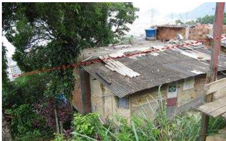
Figura 7 – As casas situadas além dos eco-limites mantêm a precariedade construtiva.