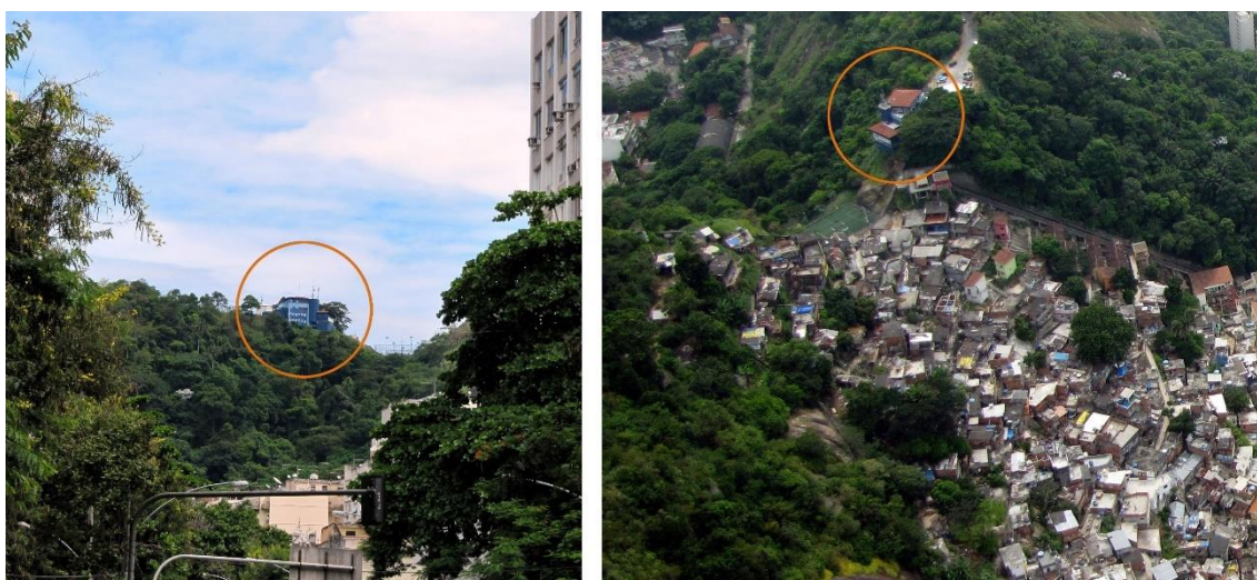
Figura 6 – A creche despontando no espaço visual de Laranjeiras e no Topo do Santa Marta.

Esta questão fica bastante evidenciada quando, em 2005, o governo do estado do Rio iniciou a construção de uma creche no topo do Morro Santa Marta (Fig. 2), que se tornou a primeira e única construção do morro que podia ser vista desde o bairro de Laranjeiras. Esta “proximidade” visual, criada, serviu como um sinal de alerta sobre a proximidade física entre a favela e o bairro que partilham encostas distintas do mesmo morro, embora o caminho conectando ambos fosse utilizado pelos moradores do Santa Marta, por décadas sem despertar qualquer incômodo. Enquanto não viam os sinais da favela, os moradores de Laranjeiras desconheciam, e não se preocupavam, com esta proximidade ou com a ligação entre eles (Fig. 6).