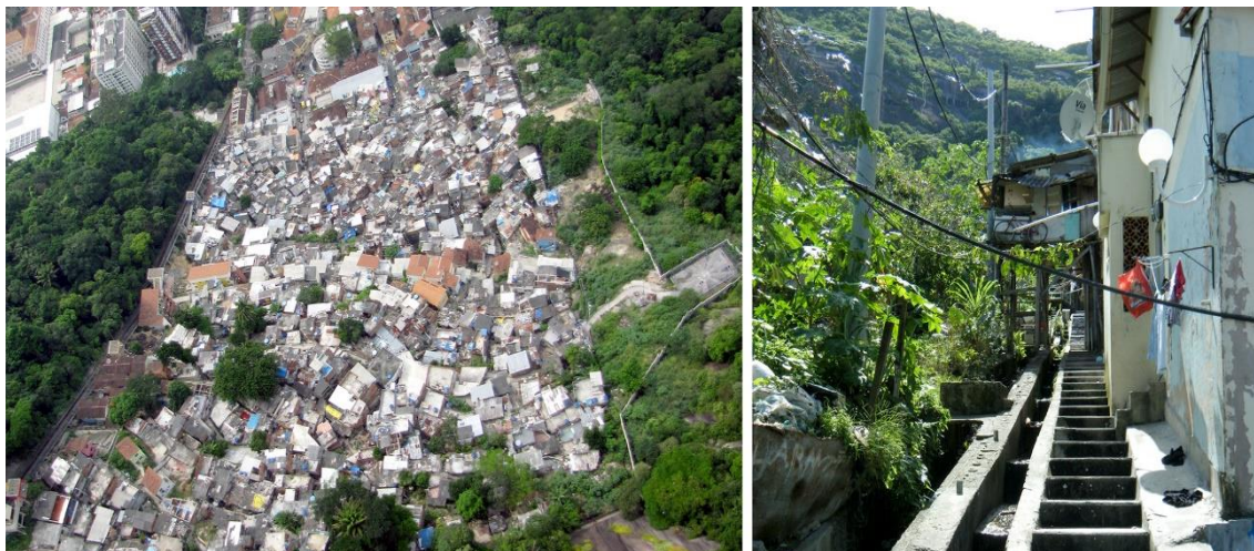
Figura 8 – À direita o muro e o perfil da ocupação original, à esquerda, as primeiras “invasões”.

A escolha do Santa Marta expõe a dificuldade oficial em lidar com o problema, visto que os limites laterais da ocupação se mantinham inalterados desde as décadas de 1960-70, tendo sofrido uma pequena redução na parte superior desde então (Fig. 8). Estes limites eram definidos por um terreno privado (e posteriormente o plano inclinado) a leste e uma longa calha de escoamento de águas pluviais a oeste, que, apesar ser uma barreira facilmente transponível, demarcava um limite simbólico claro inibindo a expansão (LOBOSCO, 2013). Por outro lado, as imagens atuais mostram que com a destituição da legitimação simbólica do limite anterior, a calha é ultrapassada em diversos pontos, inclusive por construções oficiais, visto que o muro foi instalado distante dela (Fig. 8).