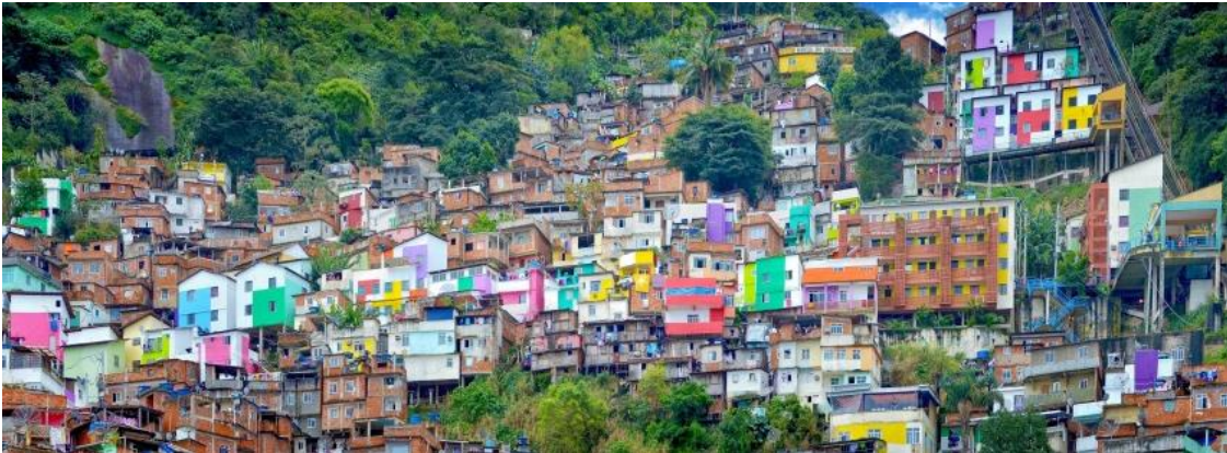
Figura 4 – Projeto “Tudo de Cor”, no Santa Marta.