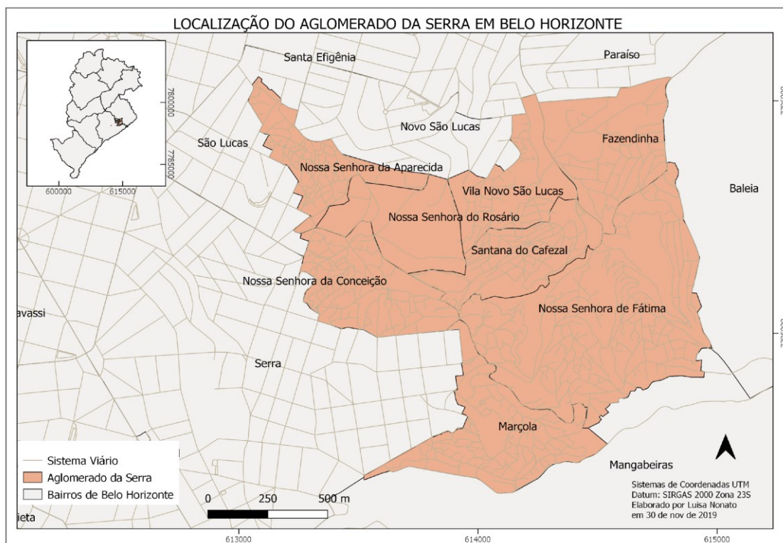
Figura 1: Localização do Aglomerado da Serra em Belo Horizonte/MG

As favelas de Belo Horizonte surgiram a partir da construção da cidade (GUIMARÃES, 1991). O Aglomerado da Serra foi se consolidando a partir da imigração e da ocupação do espaço, principalmente, por pessoas vindas do interior de Minas Gerais e de outros estados brasileiros com a expectativa de uma “vida melhor”, orientadas pelo imaginário social dos benefícios de uma cidade planejada, aliás, a segunda capital planejada do Brasil, em 1897. Clarice Libânio (2007) compreende que o processo de industrialização e do êxodo rural são alguns dos fatores desse processo de favelização na cidade. Assim, em Belo Horizonte, “as favelas foram surgindo devido à hierarquização urbana, o que propiciou a formação das favelas como se as mesmas estivessem ‘programadas’ desde a criação da nova Capital Estadual.” (LIBÂNIO, 2007, p. 23)