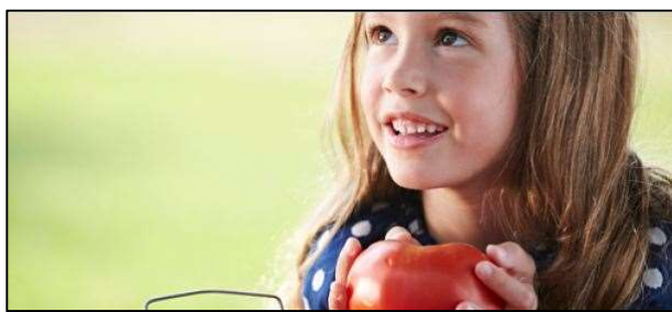
Figura 1: Publicação da Monsanto: Imagem de divulgação da produção da Monsanto.

Observa-se, na figura 1, que, em primeiro plano, uma criança cuja aparência saudável e bonita, representa que carrega um tomate vermelho, cuja aparência é bastante saudável também, assim como a criança. Essa imagem repousa sobre um plano verde facilmente associado à natureza. A imagem da criança remete à inocência, pureza e necessidade de cuidados para um crescimento saudável e feliz. Em sociedades ocidentais contemporâneas a criança é vista como um sujeito que requer cuidados, dada a sua fragilidade e por estar em processo de formação.