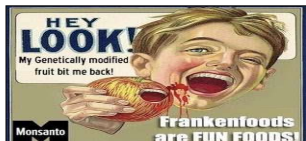
Figura 2: Imagem de reportagem mostrando a condenação da Monsanto denunciada por propaganda abusiva: Fonte: OngCea (2012).

A segurança é uma preocupação em relação a crianças, consideradas mais suscetíveis à contração de doenças. A exposição de crianças a ambientes que possam desconsiderar as normas de segurança pode incorrer em crime (abandono de incapaz) previsto não apenas no ECA, mas também Código Penal brasileiro: 'Art. 136 - Abandonar pessoa que está sob seu cuidado, guarda, vigilância ou autoridade, e, por qualquer motivo, incapaz de defender-se dos riscos resultantes do abandono'.