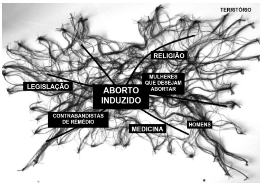
Figura 4 – Agentes sociais que produziram narrativas sobre aborto no território

No primeiro momento da pesquisa, embarquei no território com o objetivo de identificar os agentes sociais e suas narrativas. Entender os modos de funcionamento dos diferentes espaços online foi uma contribuição importante dos dados tratados que surgiu de forma espontânea a partir do contato com o campo. A internet tem um papel é central para mulheres obterem informações sobre o aborto em um contexto de ilegalidade, e surgiram também narrativas de homens que estiveram presentes nos processos de interrupção de uma gravidez. Outros autores também transitam nesse espaço de transito e significam nele o tema do aborto, como instituições religiosas, médicas e de educação. A partir das narrativas encontradas, surge a seguinte sistematização dos agentes sociais, respondendo ao primeiro objetivo específico: