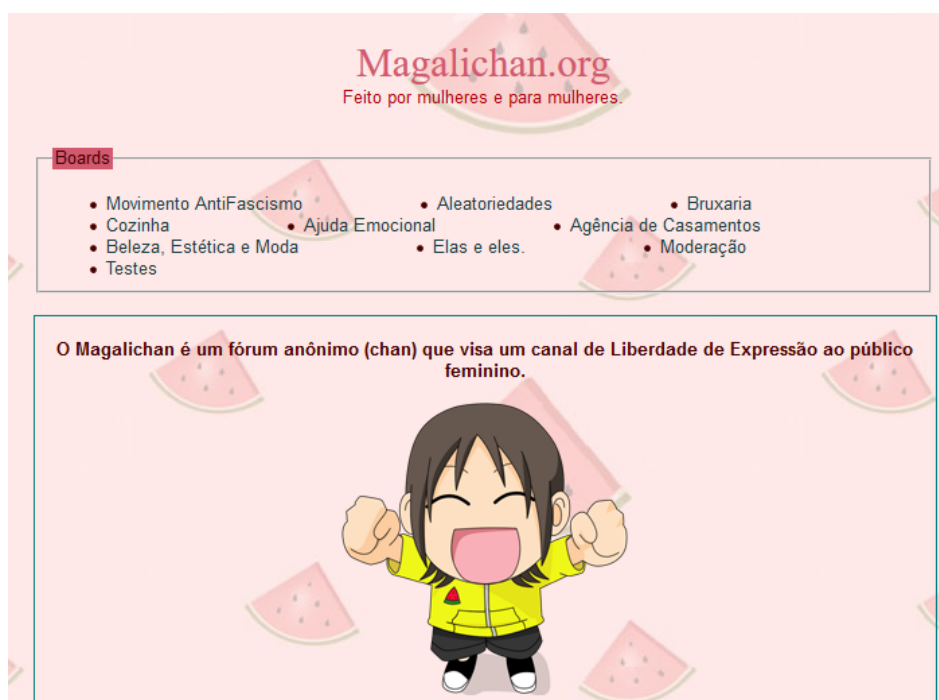
Figura 2 – Página inicial do Magalichan

Ao buscar as manifestações de narrativas sobre o aborto nesses espaços, o estabelecimento das regras se tornou um limitador. Uma vez que o ato comunicativo é mediado por um computador, conforme pontua Kozinets (2002), as identidades dos participantes da conversação são mais difíceis de serem discernidas, e a proibição de indicar ser mulher, torna essa possibilidade praticamente impossível nos chans . Não se pode, contudo, cair em generalizações. Como espaços heterogêneos entre si, enquanto no 55Chan existe uma das regras passíveis de banimento que diz: “Afirmar direta ou indiretamente ou provar ser mulher” (Administração, 55Chan), o MagaliChan têm como slogan ser um imageboard “Feito por mulheres e para mulheres”.