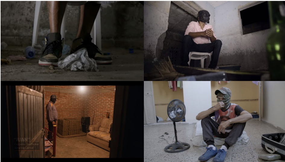
Figura 2: Traficantes latinos