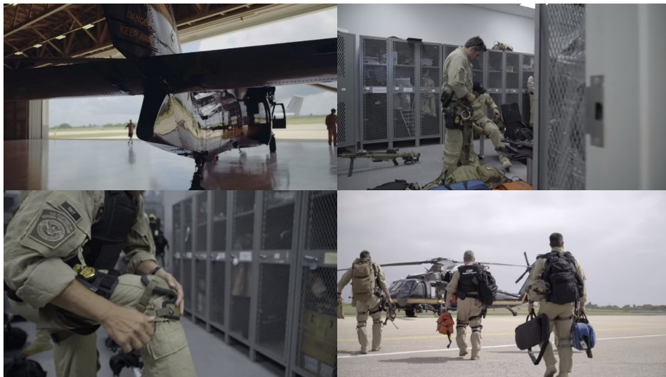
Figura 4: Sequência que evidencia os combatentes do tráfico – Efeito Marvel

trilha sonora de tensão (Figura 4), uma escolha cinematográfica que lembra um “Efeito Marvel ” – referência ao boom de filmes de super-herói na indústria cinematográfica dos efeitos visuais atualmente. Observa-se também o uso de trilha sonora com acordes de guitarra, semelhante a músicas de videogames que possuem fases, batalhas e lutas com “chefões”, que contribuem com a atmosfera de perseguição e de tensão entre herói e bandido.