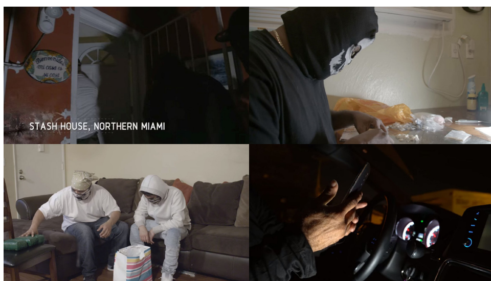
Figura 1: Traficantes nos EUA

Além das percepções dos próprios homens de negócios do comércio varejista de cocaína, os documentários articulam visualmente uma distinção nas condições de trabalho entre os países. Os empresários dos EUA aparecem em bons carros, em salas com ar condicionado, ostentam correntes, relógios, etc. (Figura 1). Em paralelo, os trabalhadores latinos do comércio ao atacado, apresentados como traficantes, estão em moradias típicas de favelas latino-americanas onde a presença de lixo e insetos comporiam o cenário cotidiano (Figura 2). Em um dos casos, o “choro de um neném” cria a atmosfera de amorosismo da atividade (DOC 2). Há nos filmes, assim, o reforço do imaginário em que os traficantes dos EUA veem o tráfico como uma oportunidade rentável, diferentemente do principal motivo destacado nos filmes, conforme montagem audiovisual, pelos traficantes latinos: a sobrevivência.