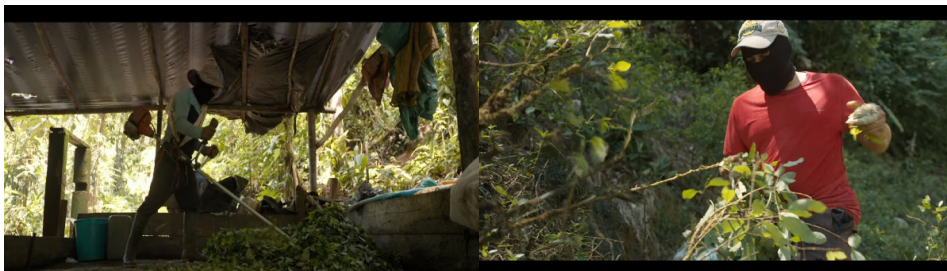
Figura 3: Plantadores de coca na Colômbia

Chega-se, assim, aos trabalhadores latinos que atuam na produção da folha de coca (Figura 3). Dessa vez, os documentários articulam imagens e informações para evidenciar as precárias condições a que esses trabalhadores estão sujeitos, reforçando, além do aspecto da violência, o controle sobre os preços da droga e da vida dessas pessoas pelos cartéis.