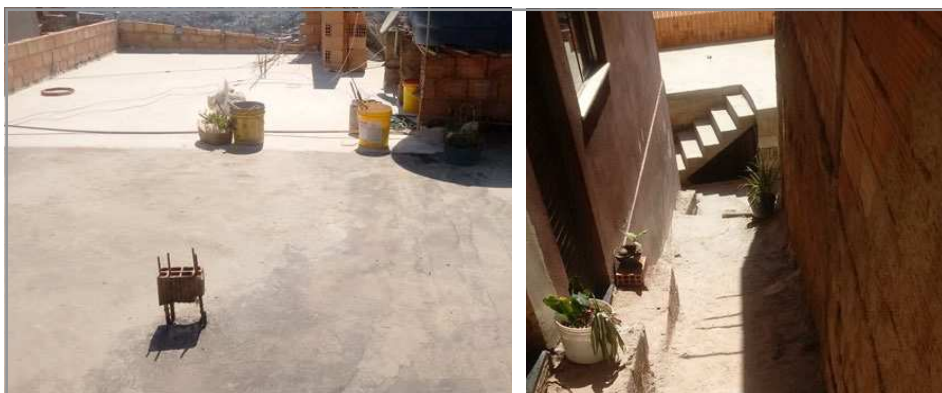
Figura 2 – Fotos da laje e do beco da Vila Cafezal enviadas por um menino de 9 anos

no contexto urbano da RMBH. As crianças enviaram imagens de becos, lajes e quintais, mas também de origamis, bonecos de massinha, brinquedos industrializados, instrumentos musicais de brinquedo e animais, como galinhas, cachorros, araras.