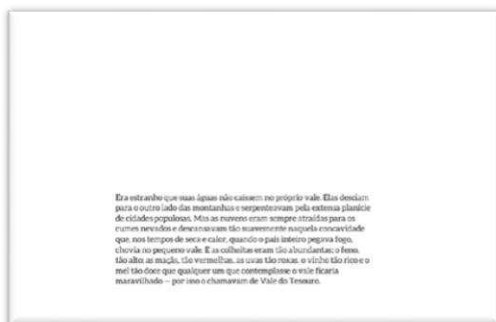
Figura 1 – Versão 1 da obra, apenas com recurso verbal

estática e em movimento e som, de cada versão, relacionando-os à compreensão do texto verbal.