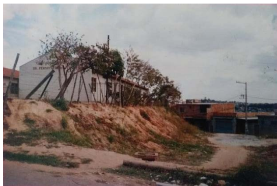
Figura 1: foto da Creche Pêrsio Pereira Pinto.

A creche atendia as famílias de baixa renda que residiam no bairro Ribeiro de Abreu. O atendimento das crianças era em tempo integral.