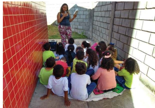
Figura 8: Contação da história.

Coloquei a música com um clip do Jairzinho “Normal é ser diferente”. Eles ouviram a música, dançaram, observaram o clip e depois conversamos em roda procurando as diferenças que nós temos. Foi muito legal!