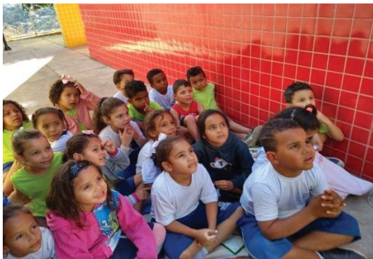
Figura 7: Contação da história.

Enquanto iam construindo o álbum em casa, realizei outras ações. Conte a história da DANDARA, A PRINCESA PERDIDA, mas não teve muita repercussão.