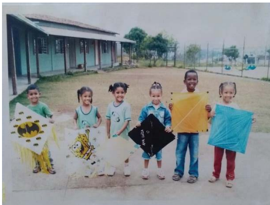
Figura 3: foto da época da municipalização.

Depois de muitas lutas políticas, a instituição deixou de ser uma unidade municipal de educação, passando a ser uma escola. Deixou de ter vínculo com a escola polo. A escola então passa a ter uma direção própria e recebe o nome de ESCOLA MUNICIPAL DE EDUCAÇÃO INFANTIL RIBEIRO DE ABREU - EMEIRA.