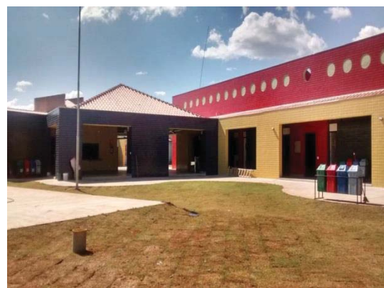
Figura 4: foto da época da entrega da obra de expansão.

Na época da municipalização, com a expansão das vagas e a modificação no critério de seleção dessas vagas, a escola passou a atender não só as famílias do bairro, mas também as famílias dos bairros vizinhos, porque ela era a única na região que atendia de forma gratuita a educação infantil.