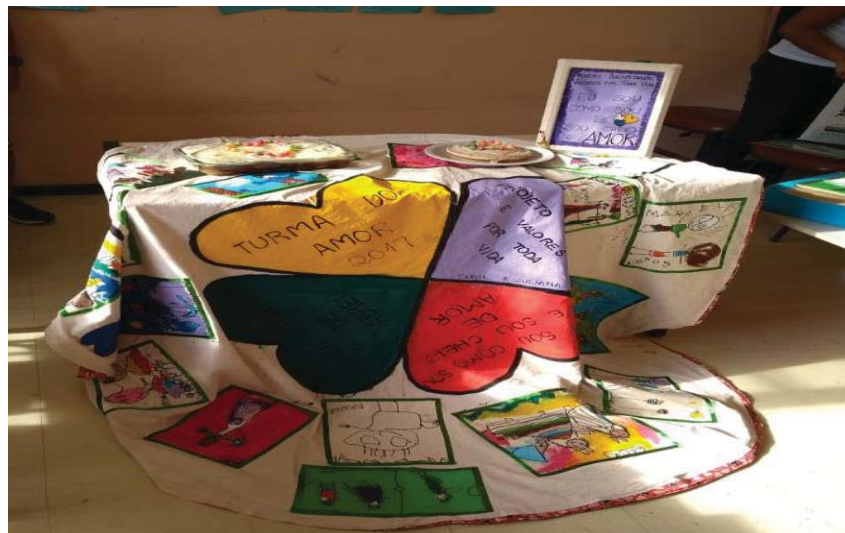
Figura 6: Culminância do projeto Identidade do ano de 2017.

O resultado desse trabalho me fez querer compreender como isso se dá. Como o conhecimento de si mesmo e da sua própria história pode auxiliar nos processos de aprendizagem e relacionamento entre as crianças. Embora eu tivesse realizado esse trabalho diversas vezes, não havia aprofundado na busca por entender esse processo de construção da identidade.