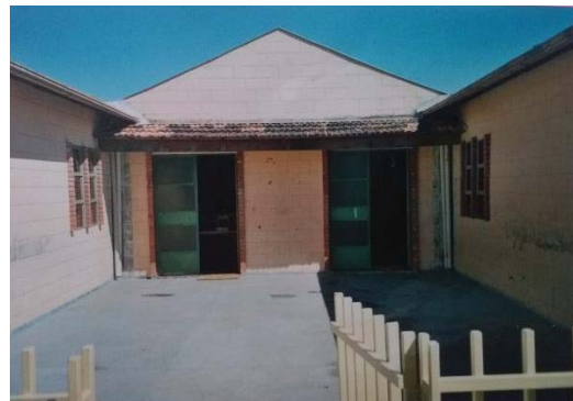
Figura 2: foto da Creche Pêrsio Pereira Pinto encontrada nos arquivos da EMEI Ribeiro de Abreu.

A creche foi municipalizada, tornando-se uma das Unidades Municipais de Educação Infantil atendendo ao plano de expansão da educação infantil da cidade. As “UMEI’s” funcionavam vinculadas a uma escola de ensino fundamental, como se fosse um