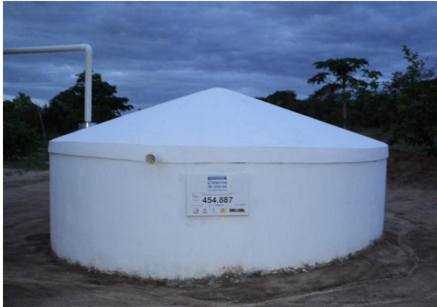
Cisterna de placas