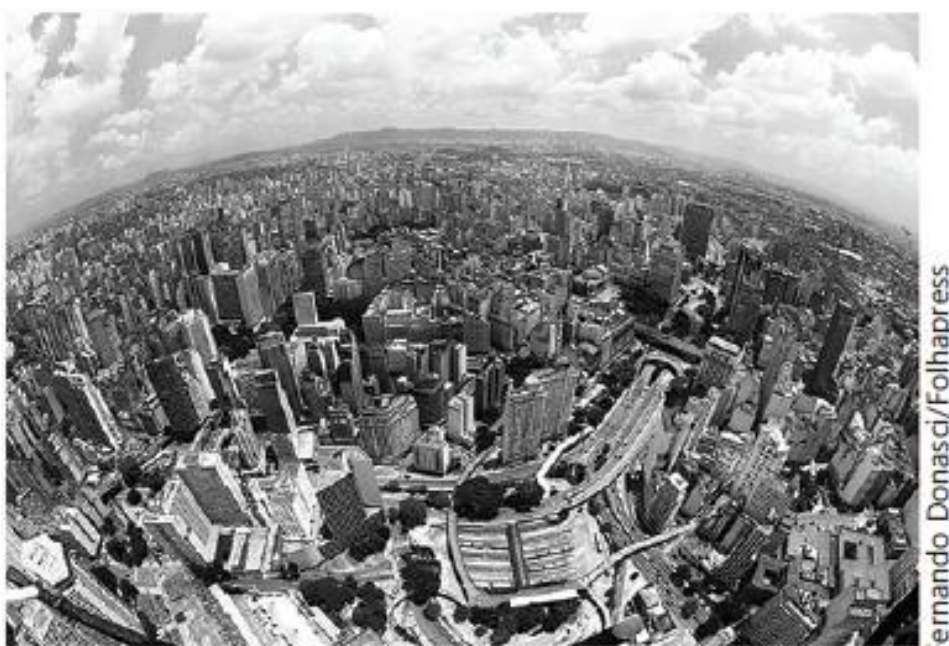
Vista aérea do centro de São Paulo

Eles estão convictos de que a Terra é plana, de que a gravidade não existe e de que está em curso um complô de cientistas e agências governamentais para nos convencer do contrário. Essa constitui mais uma das tribos exóticas que passaram a existir ou ganharam visibilidade com a internet.