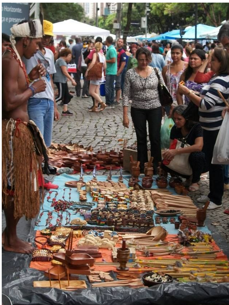
Figura 02: Forma de Exposição de Artesanato na Feira Hippie, Belo Horizonte, 2014.

Nesse contexto urbano, em que a burocracia não acolhe as etnias indígenas para a exposição de seus produtos artesanais, devido à possibilidade de apreensão pela fiscalização, os indígenas usam da estratégia de expor em panos diretamente sobre a calçada, os quais são mais facilmente desmontáveis e, conseqüentemente, possibilitam que haja uma eventual fuga com os materiais.