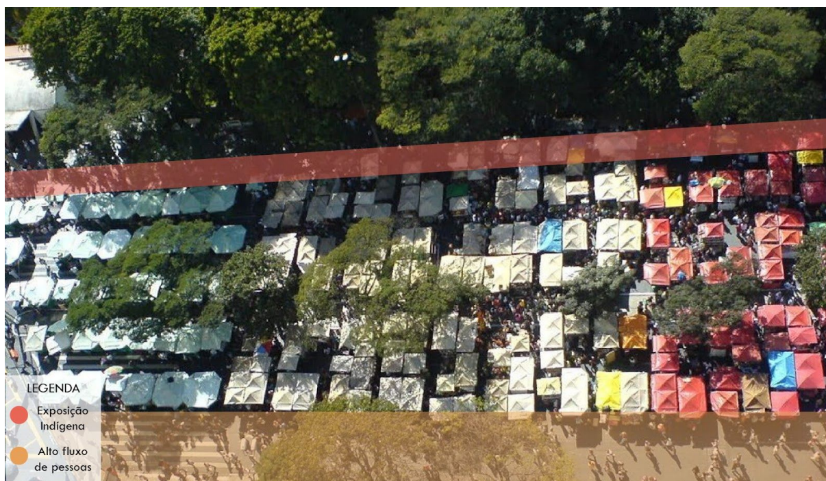
Figura 02: Posicionamento da Venda do Artesanato Indígena na Feira Hippie.

Se houvessem barracas, fato que seria propiciado por uma medida que os incluísse legalmente nas feiras urbanas da cidade, outros produtos típicos de cada etnia poderiam ser vendidos - como alimentos, grãos, cerâmicas, comidas típicas, garrafadas 12 , outros produtos medicinais tradicionais, etc. Com essa conquista, a comunidade urbana conheceria melhor essas diversas culturas originárias e os preconceitos, conseqüentemente, seriam atenuados. No que diz respeito a invisibilidade, esta é marcada especialmente pelo posicionamento dos indígenas na Feira Hippie, visto que dispõem os seus produtos à margem, do lado oposto à região de maior fluxo - conforme expõe o diagrama abaixo. Se por um lado esta condição marginal pode ser vista como positiva, se considerarmos que assim também não estão tão expostos para os fiscais e os tapetes produzem uma imagem diferenciada em relação às barracas, por outro só sublinha tal forçada imagem de marginal e fora da ordem pois não tem espaços oficiais para a exposição.