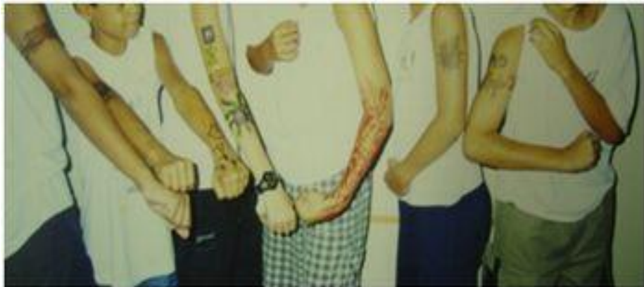
Figura 11: Pintura corporal na escola.