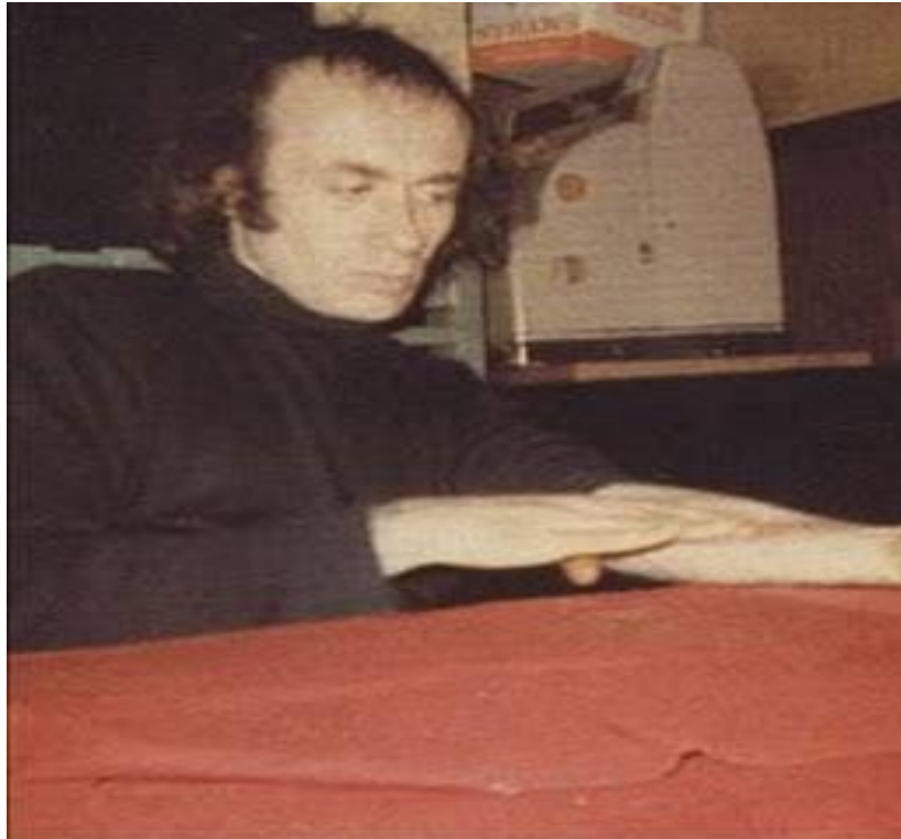
Figura 9: Rubbing Piece.