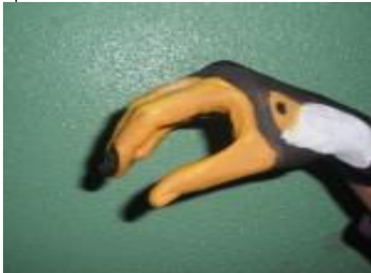
Figura 12: Pintura corporal na escola