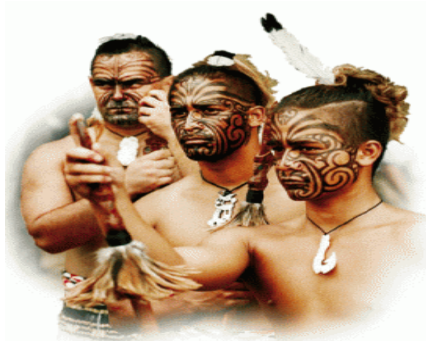
Figura 3: Os Samoanos

Para os Samoanos, o ato de pintar o corpo marcava a passagem da infância para a maioridade. Enquanto não fosse marcado, o membro da tribo, por mais velho que fosse não teria voz numa roda de adultos, nem teria permissão para tomar uma esposa para si. A tatuagem também funcionava como instrumento de ascensão social: Quanto mais tatuado fosse o Samoano, mais alto seria seu estatuto na tribo.