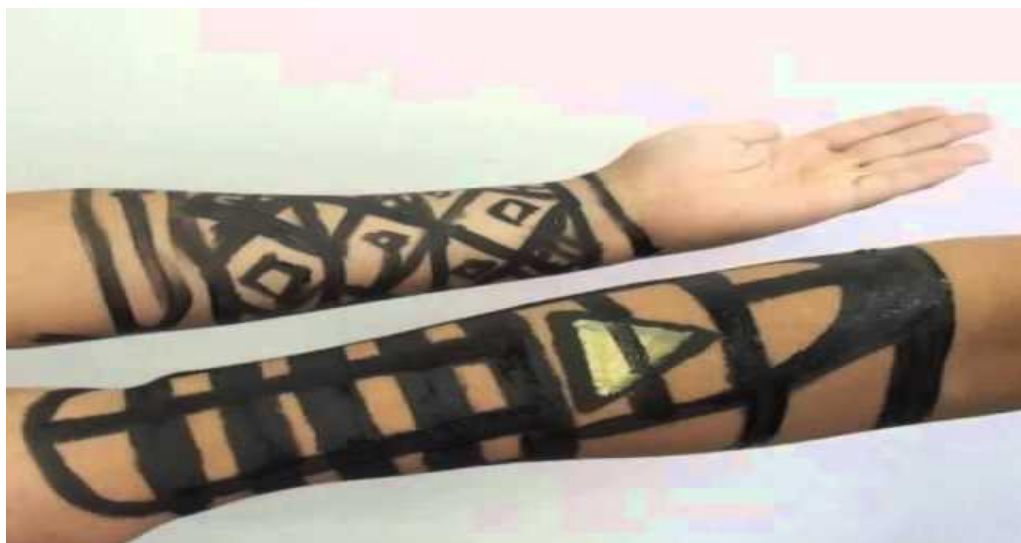
Figura 5: Pintura Corporal Kaiapo.