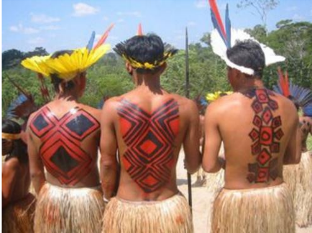
Figura 6: Pintura no corpo.