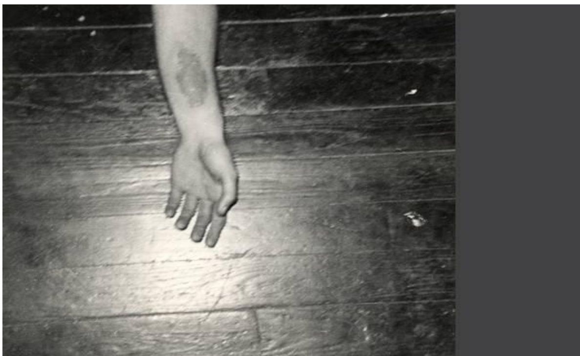
Figura 1: Corpo e alma (Vito Acconci, 1940)

Pode ser citado, por exemplo, entre muitos outros, o Rubbing Piece , 1970, encenado em Nova York, por Vito Acconci (1940), em que o artista esfrega o próprio braço até produzir uma ferida. O sangue, o suor, o esperma, a saliva e outros fluidos corpóreos mobilizados nos trabalhos interpelam a materialidade do corpo, que se apresenta como suporte para cenas e gestos que tomam por vezes a forma de rituais e sacrifícios.