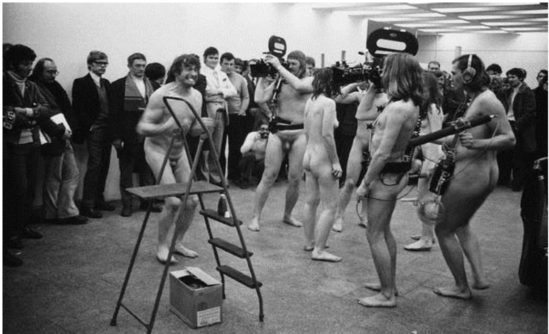
Figura 8: Performances