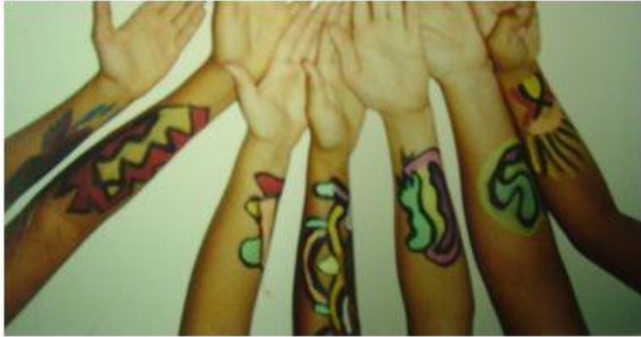
Figura 10: Pintura corporal na escola.