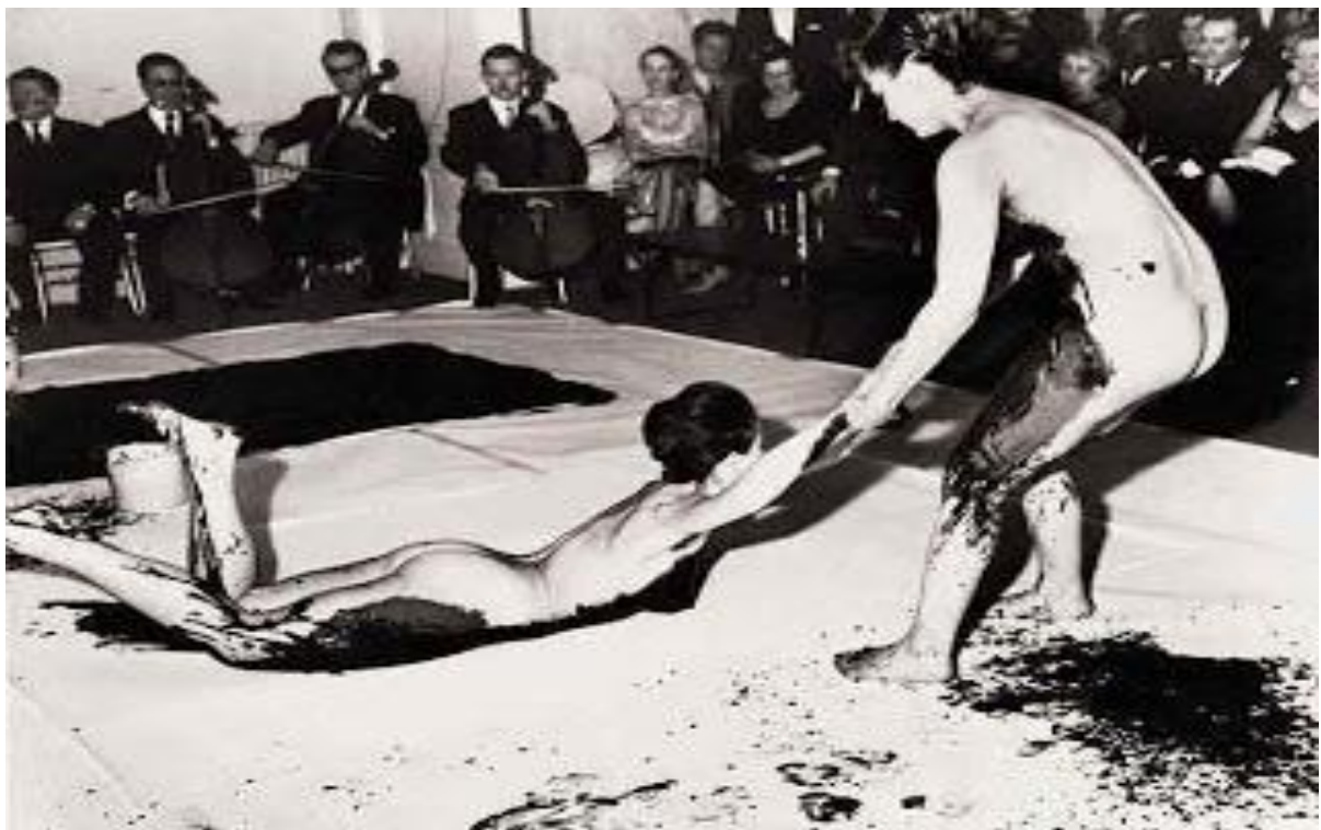
Figura 2: Body Art o Francês Yves Klein