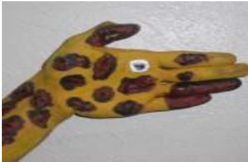
Figura 13: Pintura corporal na escola.