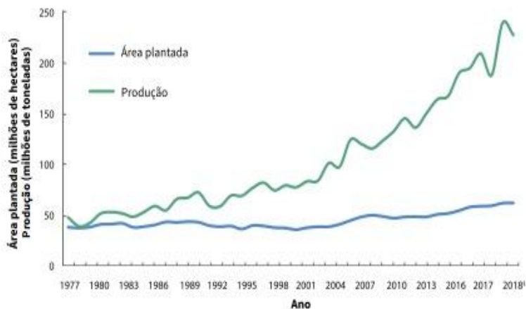
Visão 2030 – O futuro da Agricultura Brasileira – Embrapa 2018

A tecnologia e a melhoria dos procedimentos concernentes a esse cenário (nessa caso, aqueles referentes ao Direito) assumem singular importância diante da importância do agronegócio e da profunda articulação que promove em todos os setores da vida nacional: