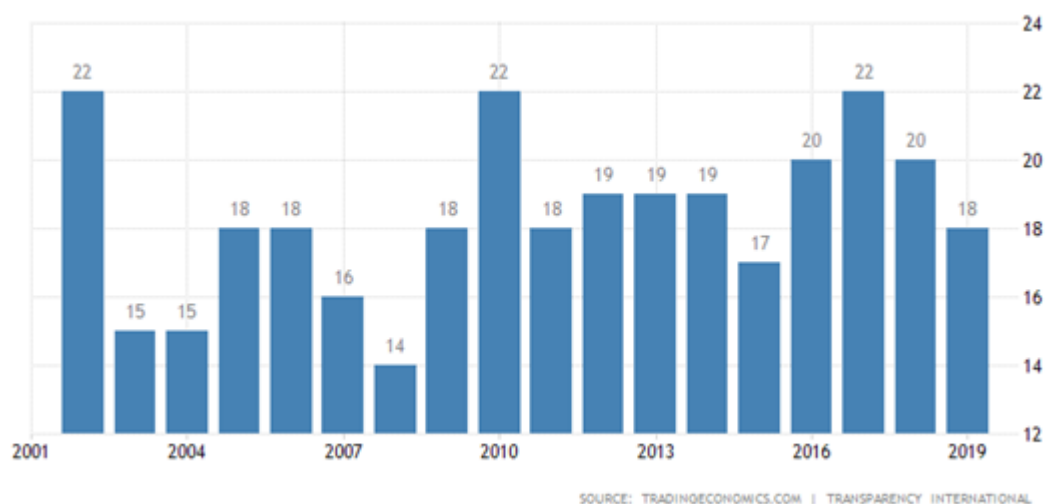
Gráfico 6 – Evolução do índice de percepção da corrupção no Haiti.