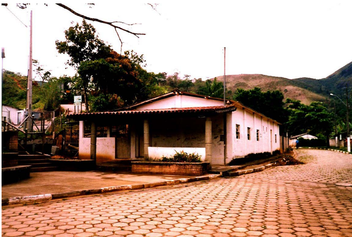
FIGURA 4 Vista da sede do Clube Dançante Nossa Senhora do Rosário