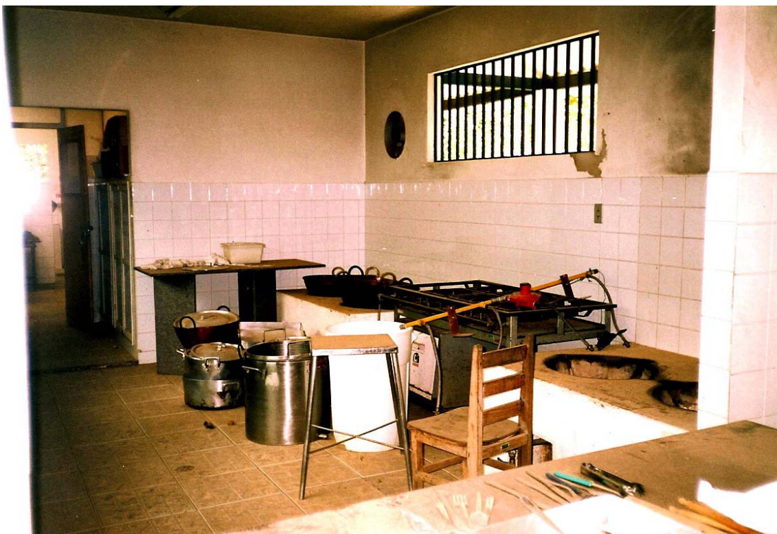
FIGURA 13 Vista interna da cooperativa paralisada