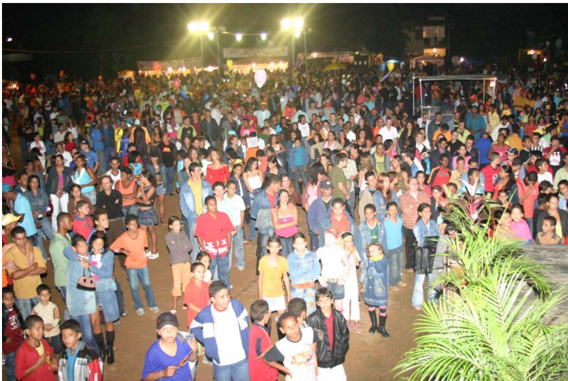
FIGURA 16 Festival da Banana em 2006