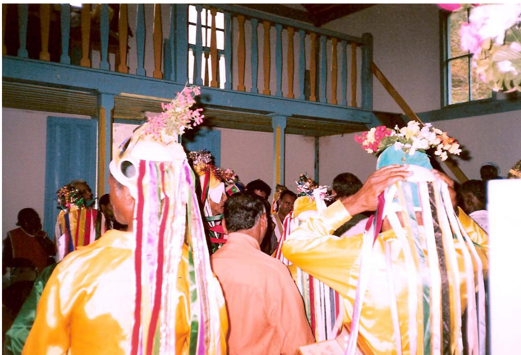
FIGURA 8 Missa na Igreja São Vicente de Paula durante a Festa do Divino