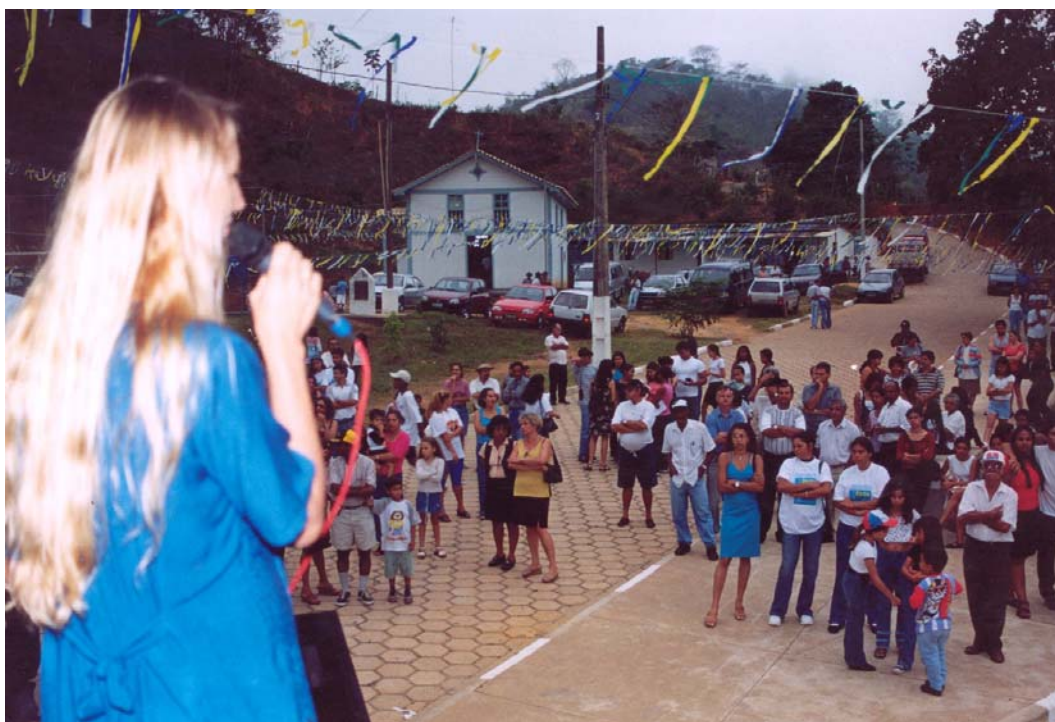
FIGURA 9 Festa de inauguração do museu e do congado mirim