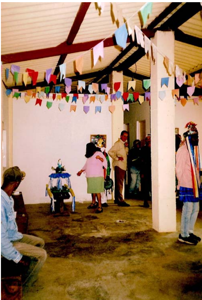
FIGURA 7 Vista interna da sede em dia de Festa do Divino