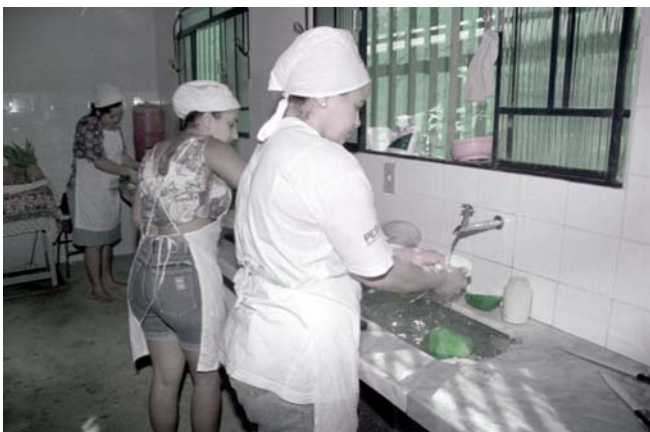
FIGURA 14 Cooperativa em funcionamento