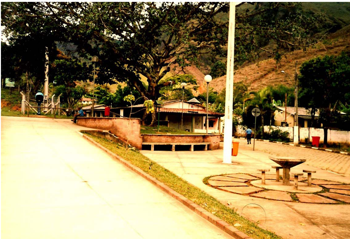
FIGURA 5 Vista da sede do Clube Dançante e da praça