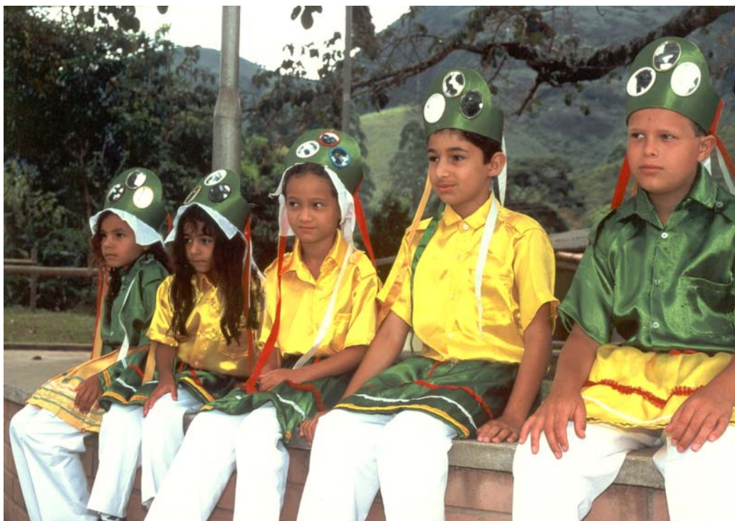
FIGURA 11 Congado mirim