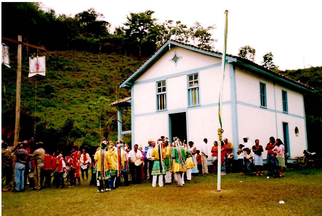
FIGURA 1 Clube Dançante Nossa Senhora do Rosário em dia de Festa do Divino