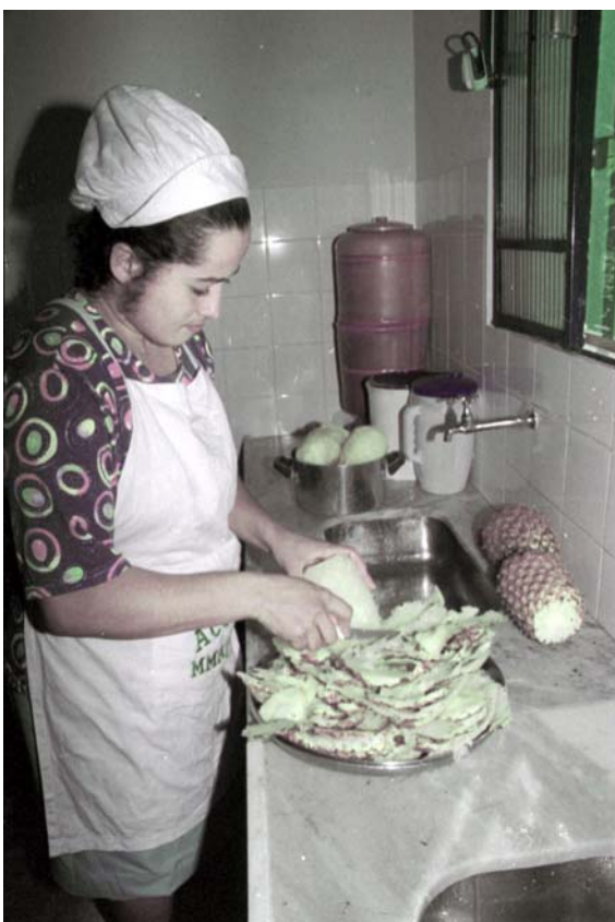
FIGURA 15 Cooperativa em funcionamento e preparo de doces