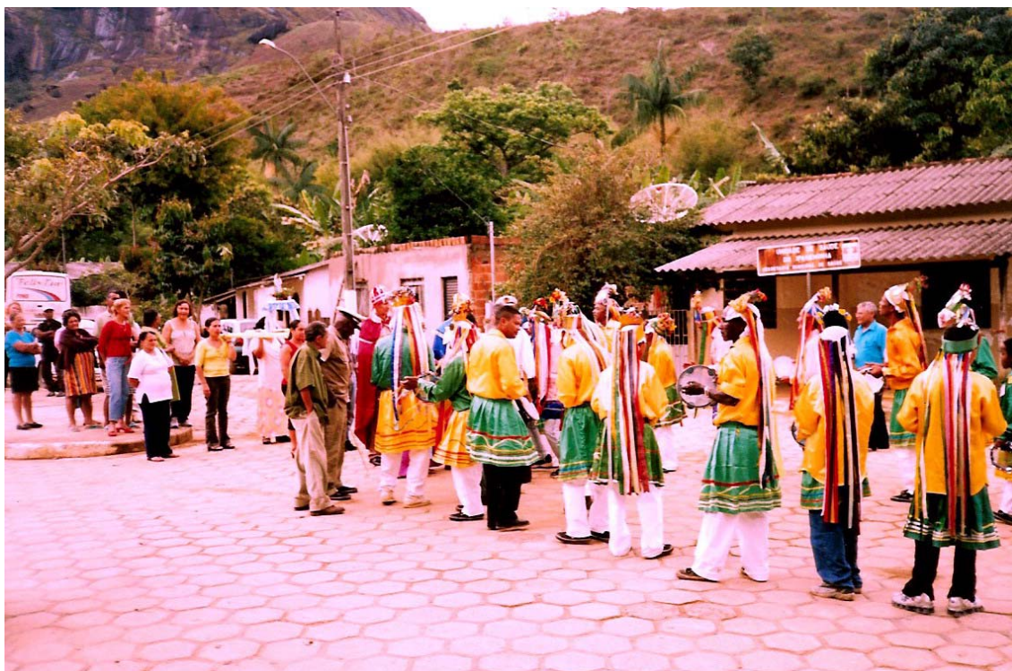
FIGURA 2 Procissão do congado em celebração à Festa do Divino