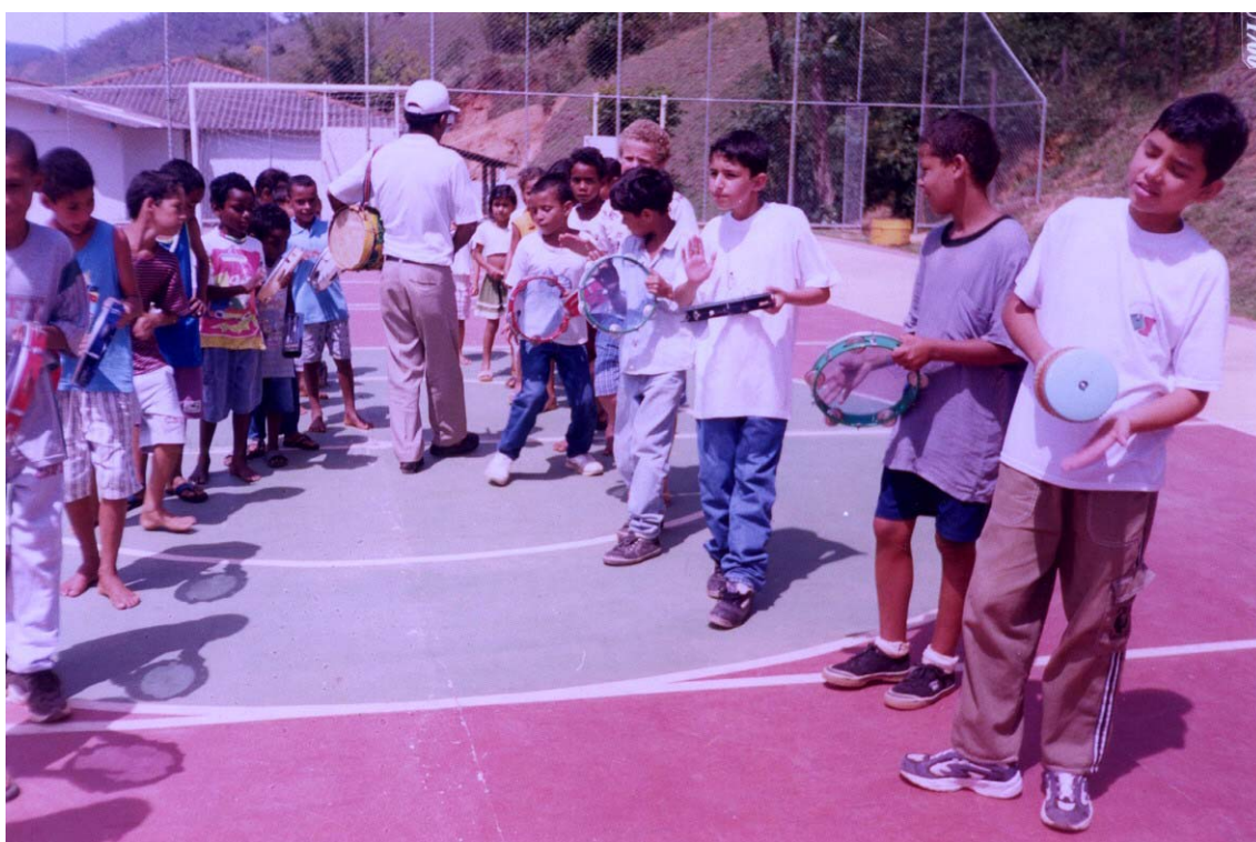
FIGURA 10 Oficina de formação do congado mirim