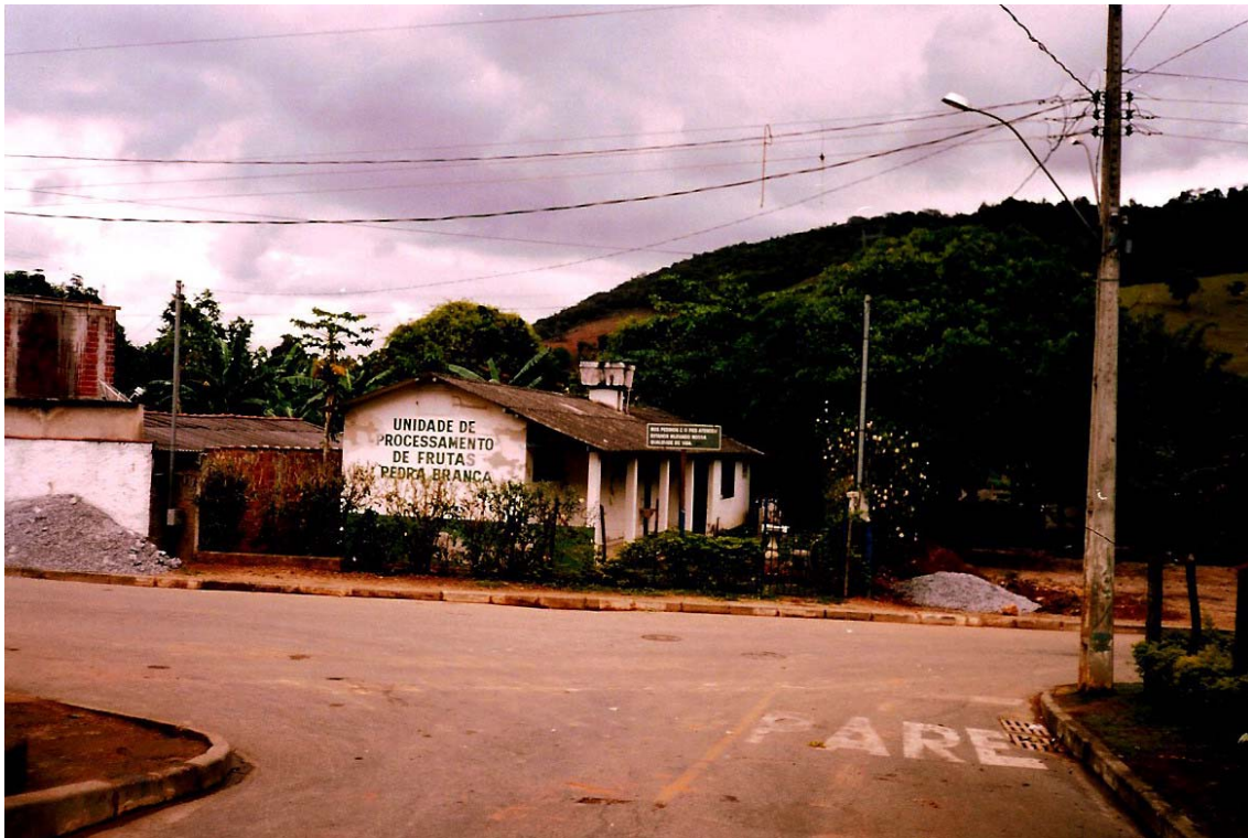
FIGURA 12 Vista da Cooperativa de Beneficiamento de Doces de Frutas