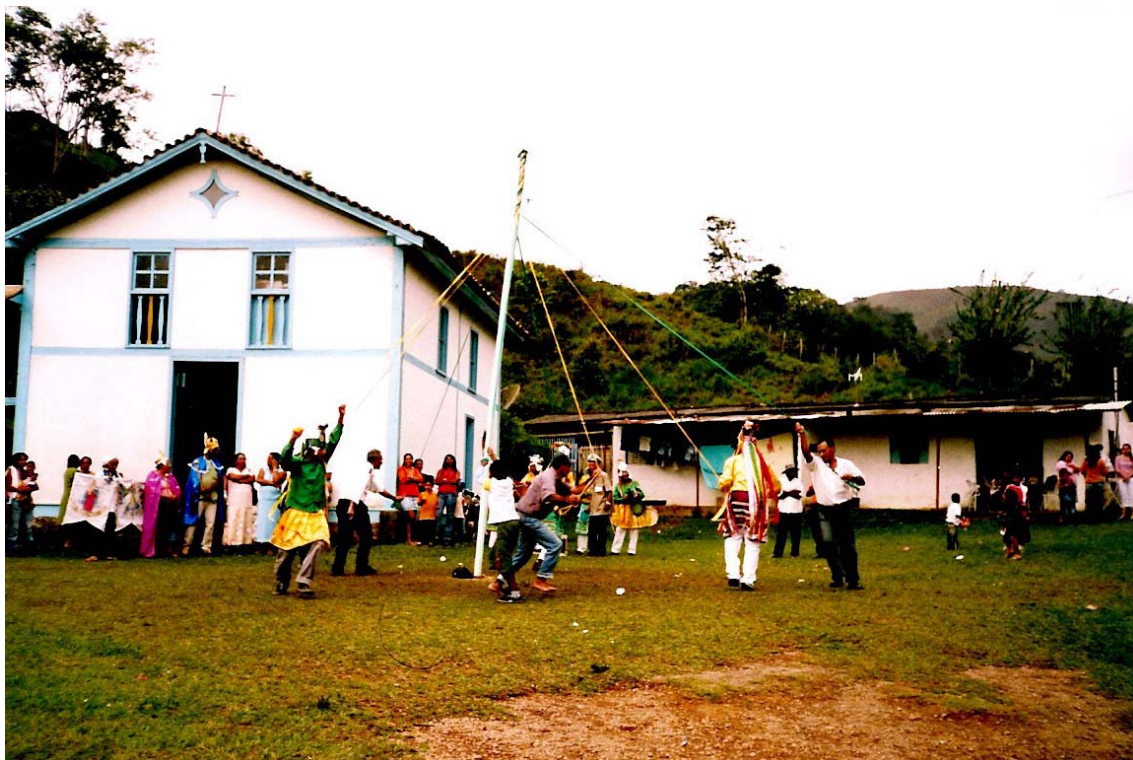
FIGURA 3 Dança de Fitas na Festa do Divino