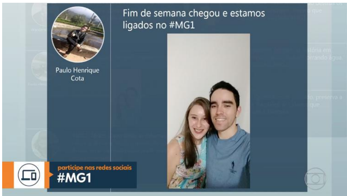
Figura 01 – Participação exibida no dia 24/03/2018, acessível em: https://globoplay.globo.com/v/6603589/programa/ .