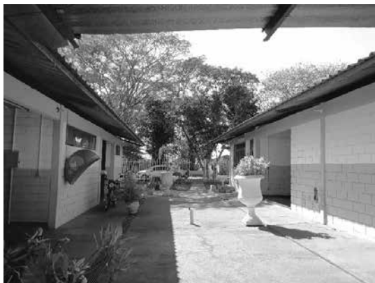
Figura 2 – Polo UAB Corinto-MG