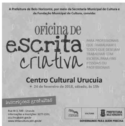
Figura 7 – Oficina na PBH

Para nós, oficinairos da Oficina Escrita Criativa, a experiência de ministrar o minicurso no polo de Corinto nos trouxe satisfação pela contribuição social e se configurou numa rica troca de saberes e de experiências, que acrescentou muito à nossa formação humanística e intelectual. Foi uma experiência importante que estamos levando para outras instâncias (Figura 7), tendo permanecido o caráter voluntário da ação e o desejo de contribuir com a sociedade.