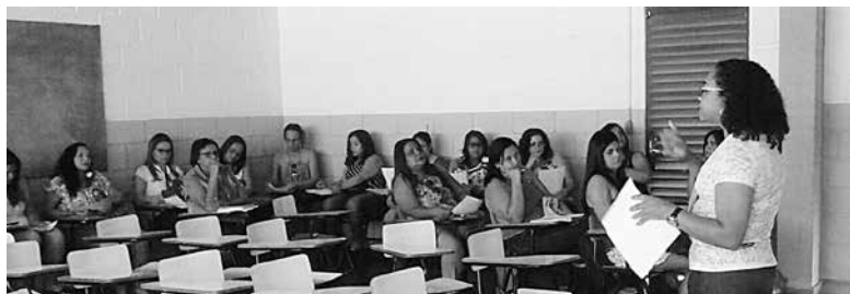
Figuras 4 e 5 – Oficina Escrita Criativa